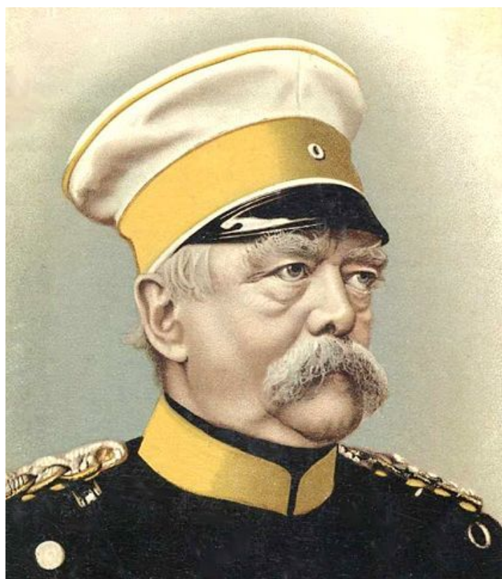
Отто фон Бисмарк