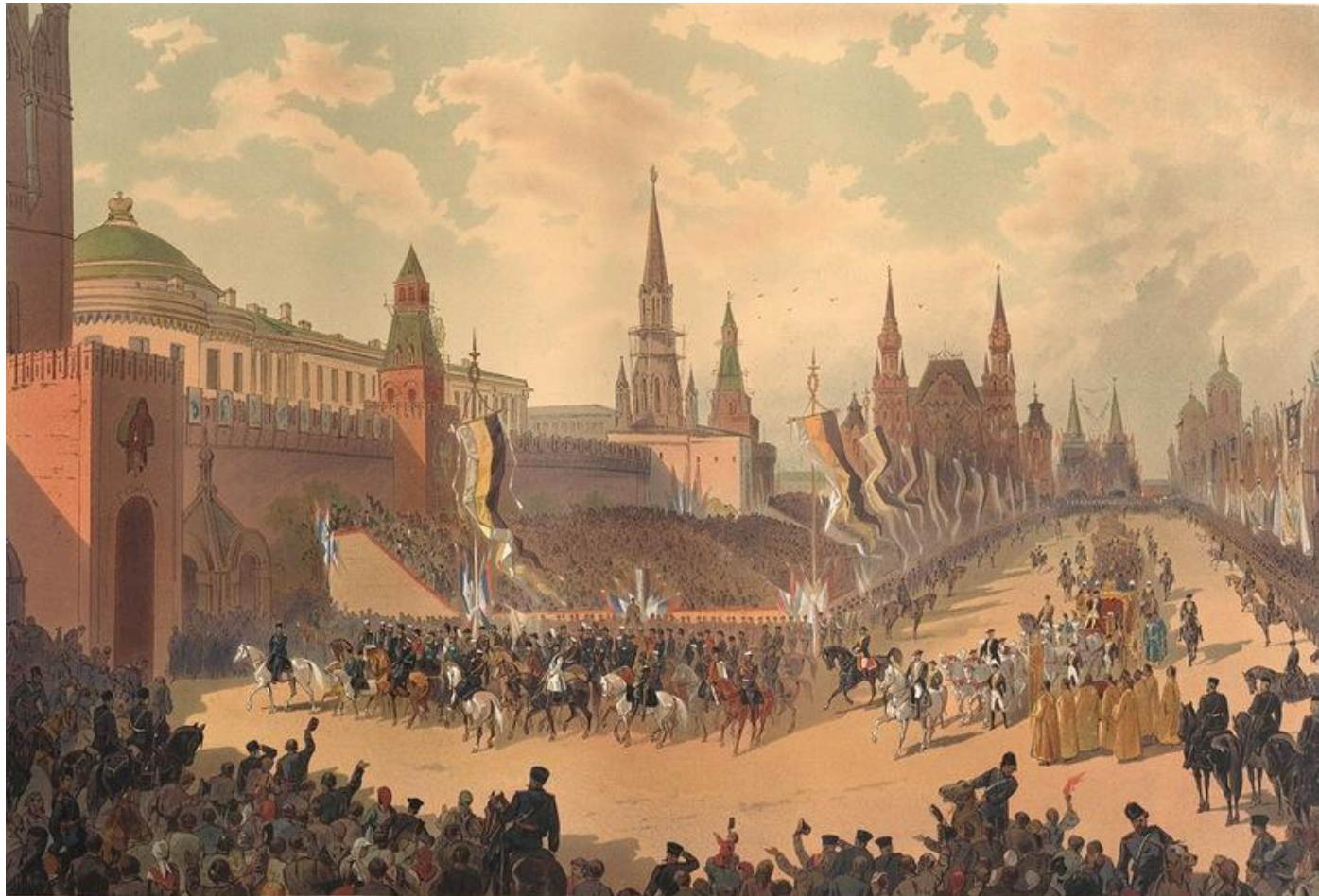
ТОРЖЕСТВЕННЫЙ ПРОЕЗД ЧЕРЕЗ КРАСНУЮ ПЛОЩАДЬ.