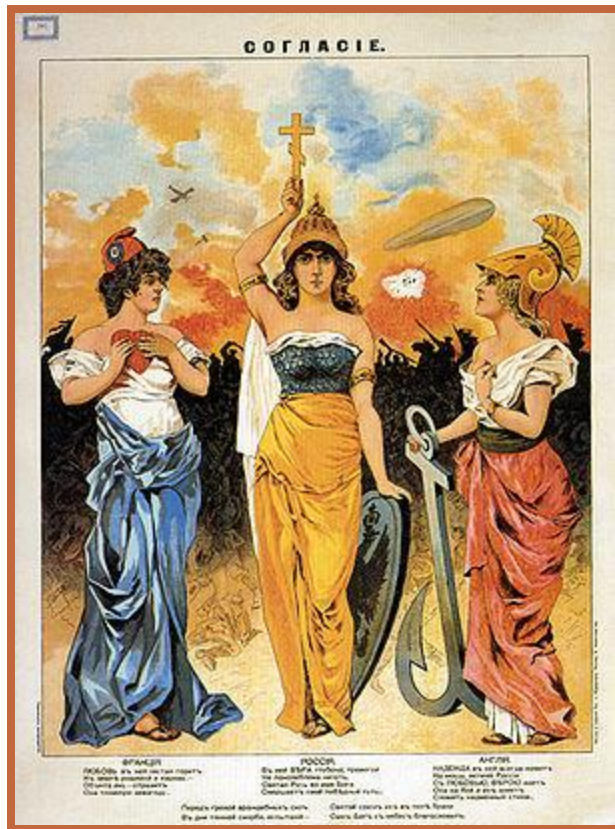
Аллегорическое изображение Антанты

Рубеж XIX-XX вв. – Тройственный союз и Антанта.