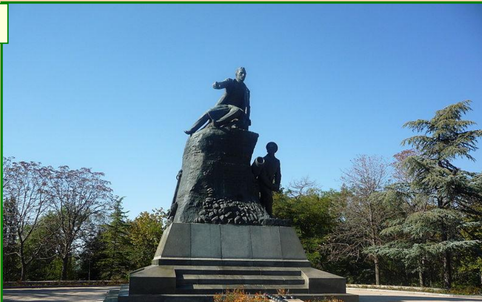
Памятник Корнилову на месте его смертельного ранения

Командующий обороной Севастополя адмирал В.А. Корнилов приказал затопить у входа в бухту корабли Черноморской эскадры, чтобы корабли англо-французской эскадры не могли подойти к городу. Перед затоплением с кораблей сняли пушки и перенесли их на береговые батареи. Вскоре противник начал штурмовать Севастополь.