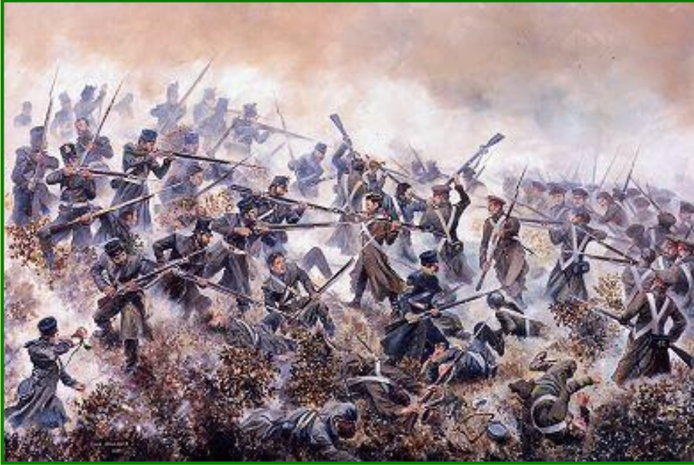
Сражение Крымской войны