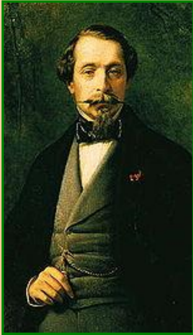
Наполеон III – император Франции