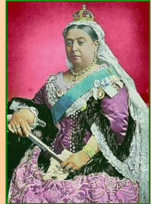
Виктория – королева Англии

Неожиданно для Николая I Англия и Франция заключили военный союз с Турцией и потребовали вывода русских войск из Дунайских княжеств. Не дождавшись выполнения своих требований в марте 1854 г. Англия и Франция объявили войну России.