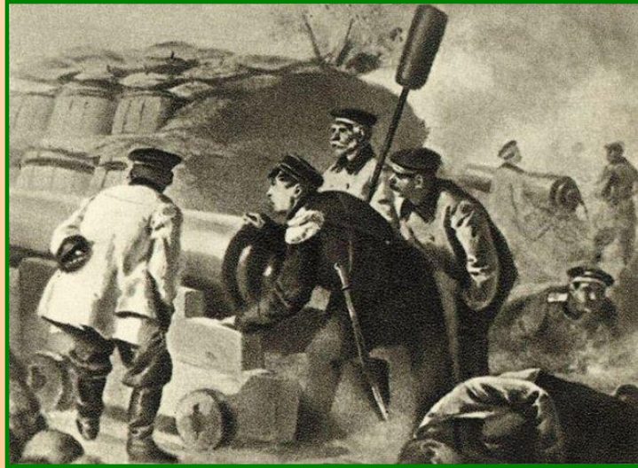
Адмирал П.И.Нахимов на батарее