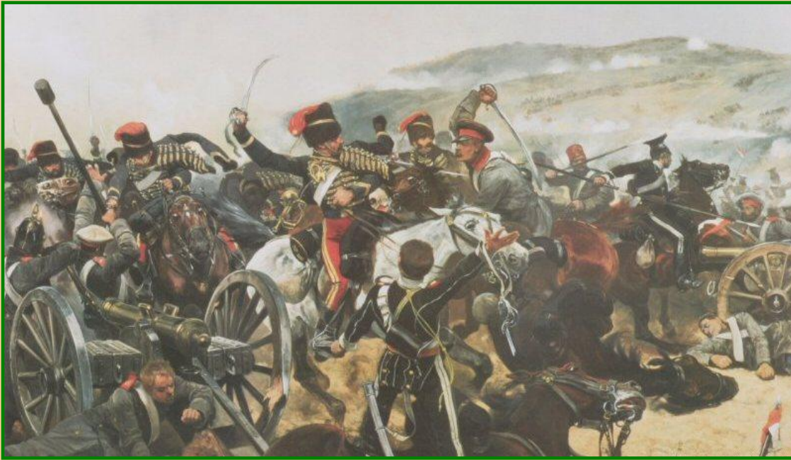
Сражение русской и английской кавалерии

Затягивание боевых действий и большие потери вызывали недовольство в Англии и Франции. В августе 1855 г. была предпринята последняя бомбардировка. Союзники заняли Малахов курган и защитники города, перейдя по мосту через бухту, оставили город. После падения Севастополя были оставлены Анапа, Керчь, Еникале и Кинбурн.