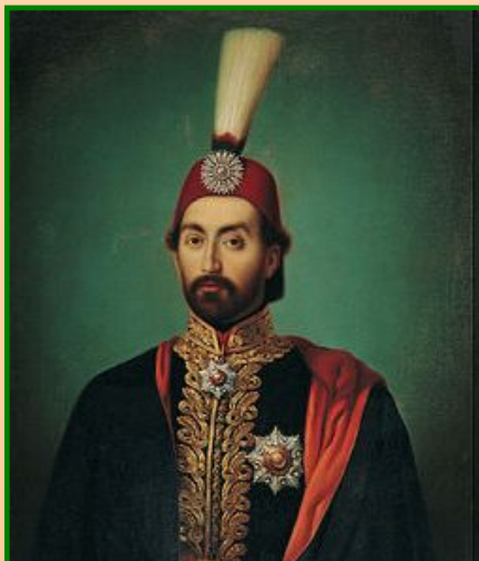
Султан Абдул- Меджид