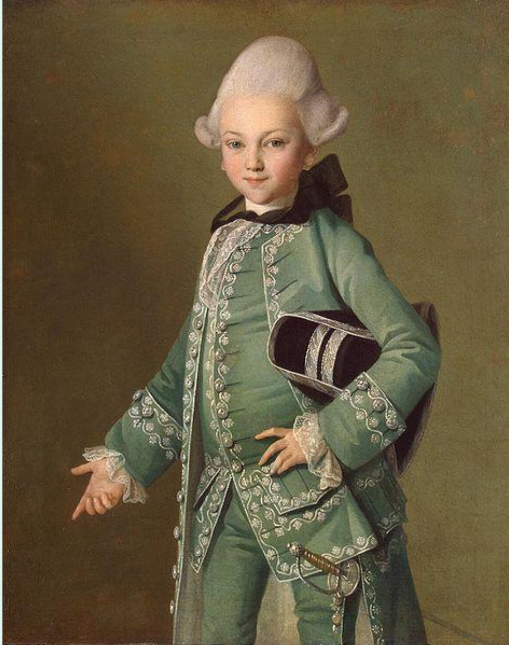
Алексей Григорьевич Бобринский – внебрачный сын императрицы