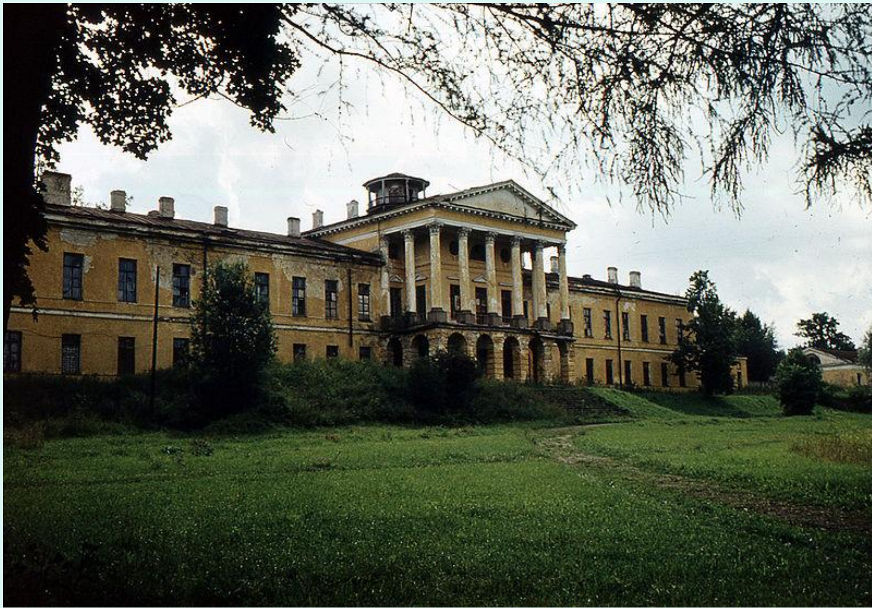
Дворец в Ропше, здесь погиб Петр III