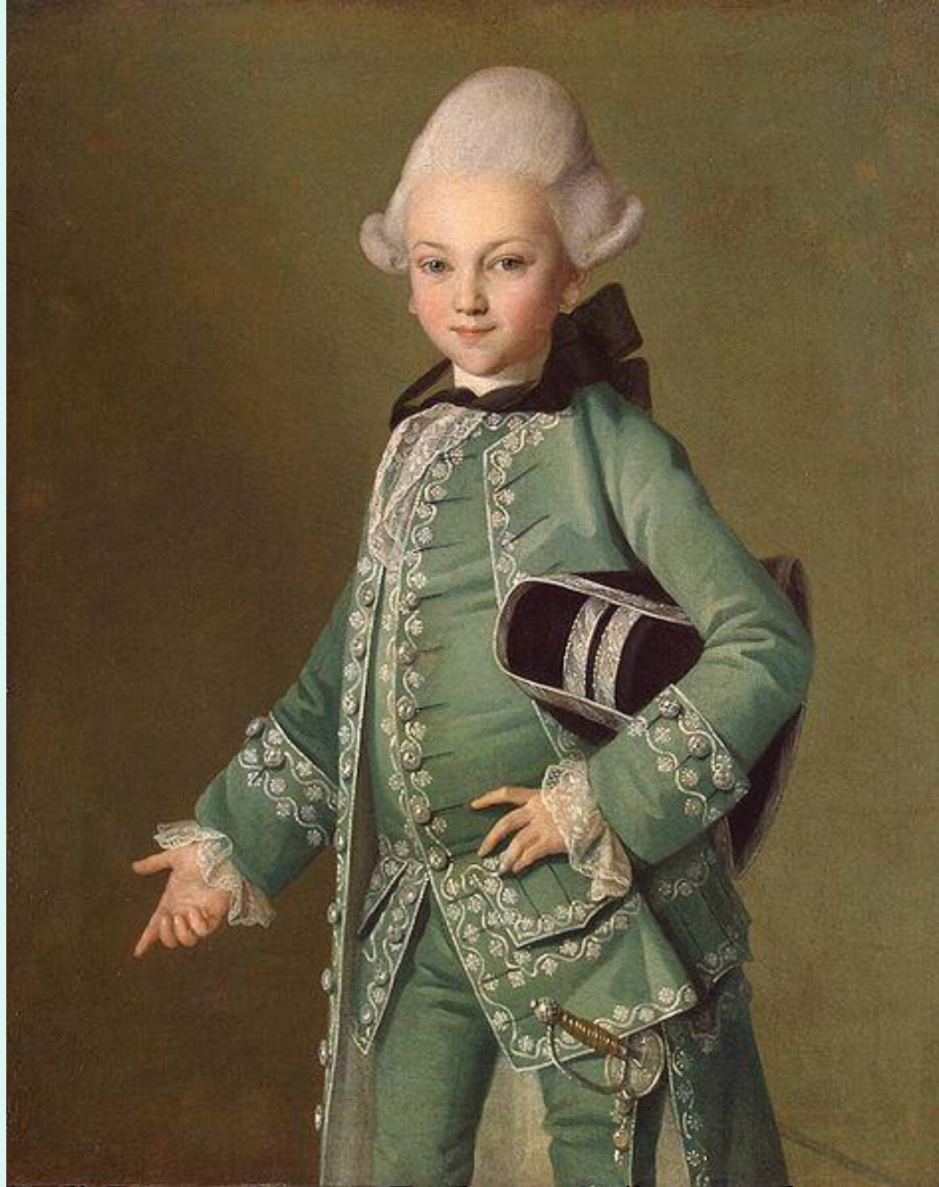
Алексей Григорьевич Бобринский – внебрачный сын императрицы