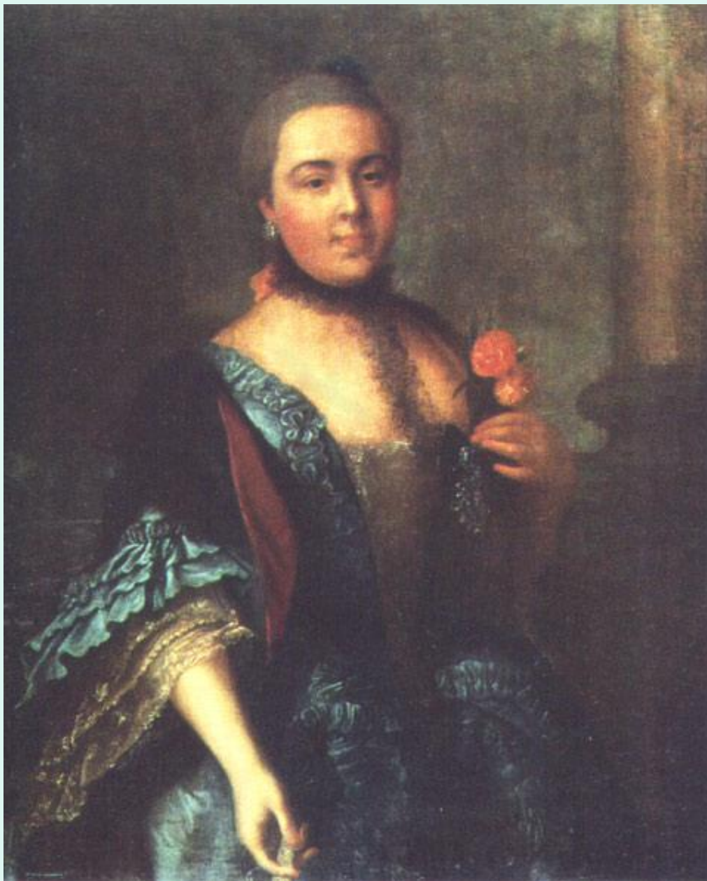
Елизавета Воронцова – фаворитка Петра 3