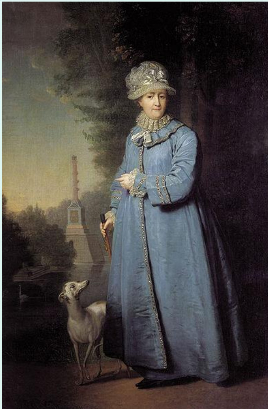
Екатерина II на прогулке