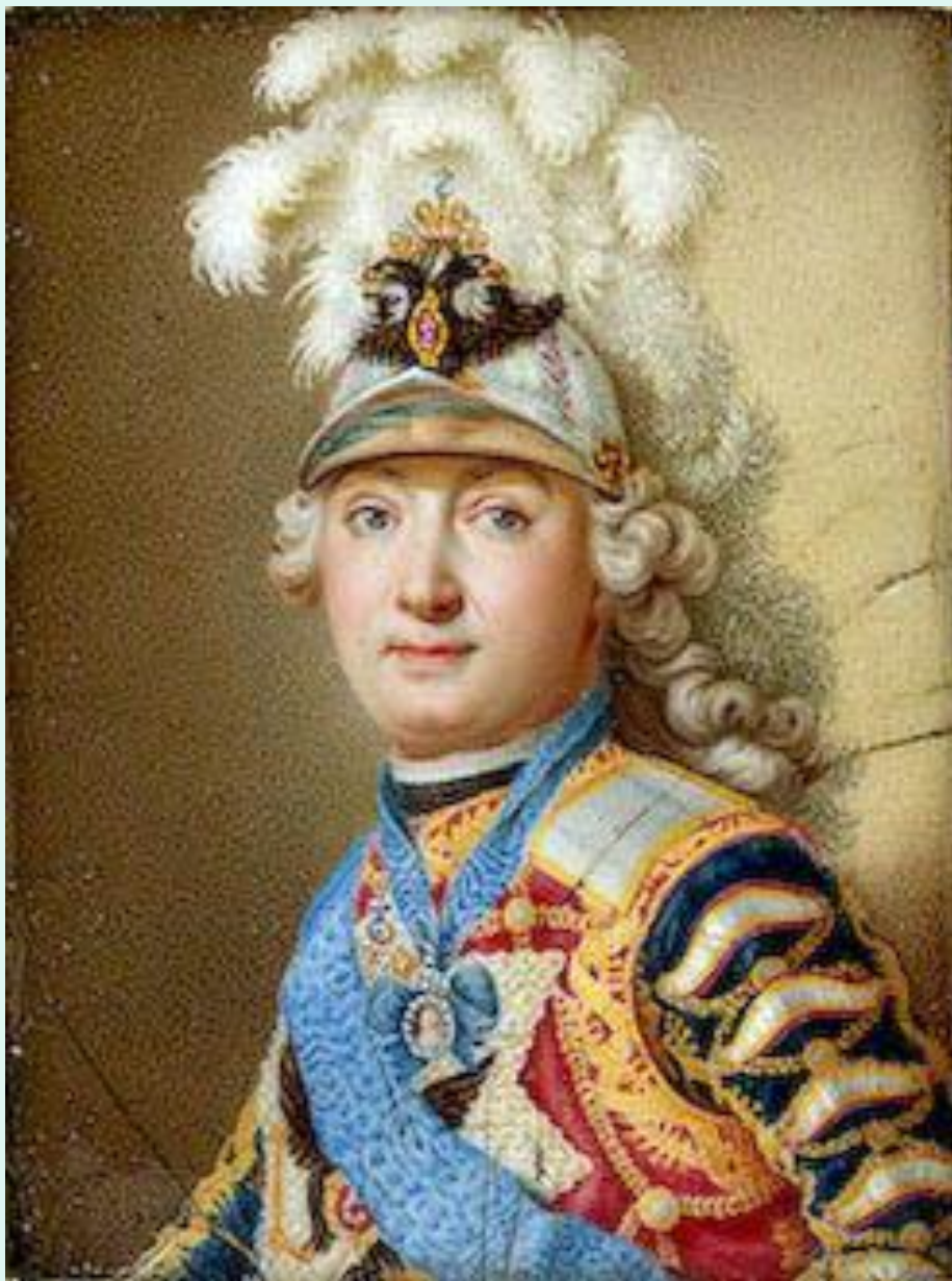
Орлов Григорий Григорьевич – участник дворцового переворота 1762 года, фаворит Екатерины Великой