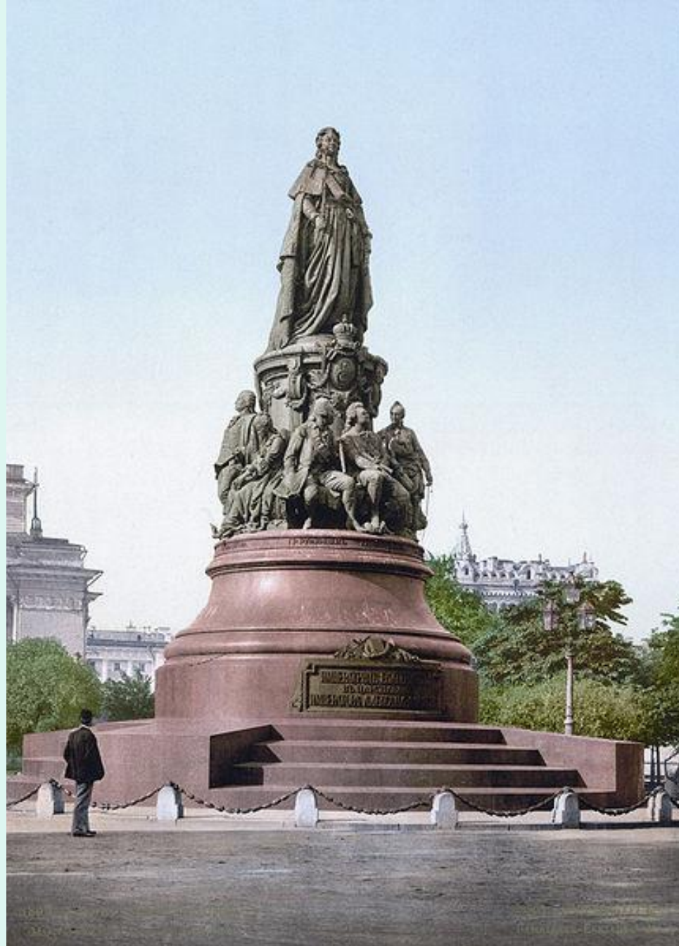
Памятник Екатерине II в Санкт-Петербурге