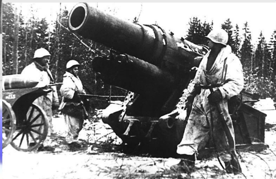
Немецкое тяжелое осадное орудие, обстреливавшее Ленинград