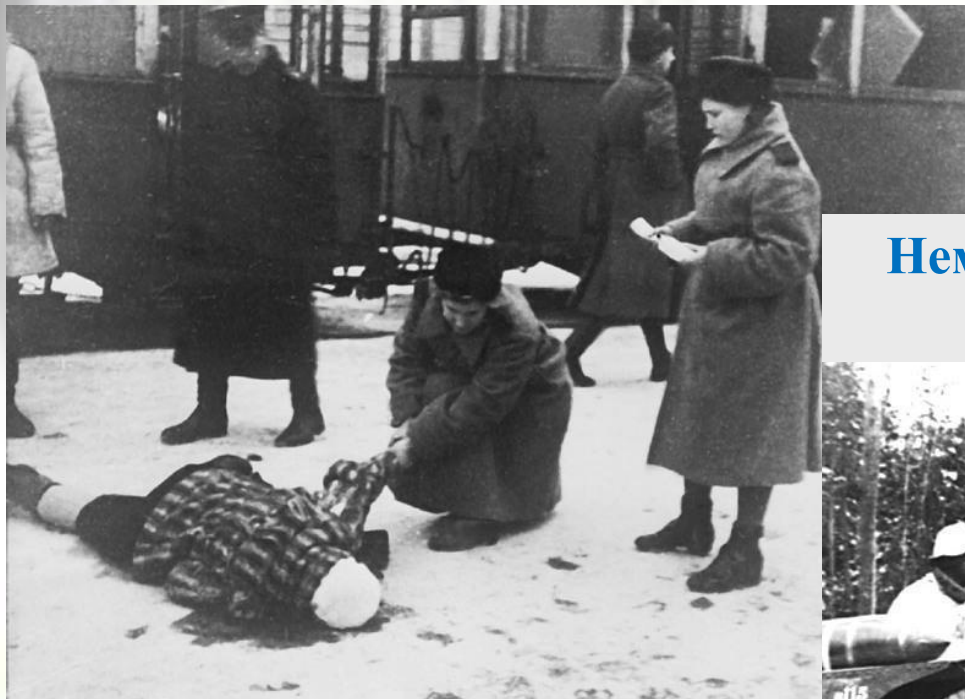
Результаты обстрела. Ленинград, декабрь 1943 г.

После провала немецкого блицкрига В.Лееб был отстранен от командования группой «Север». Его место занял генерал-полковник Г. Кюхлер. Выполняя приказ Гитлера, новый командующий начал вести войну на уничтожение. Немцы обстреливали улицы, сбрасывали бомбы, затапливали продовольственные обозы.