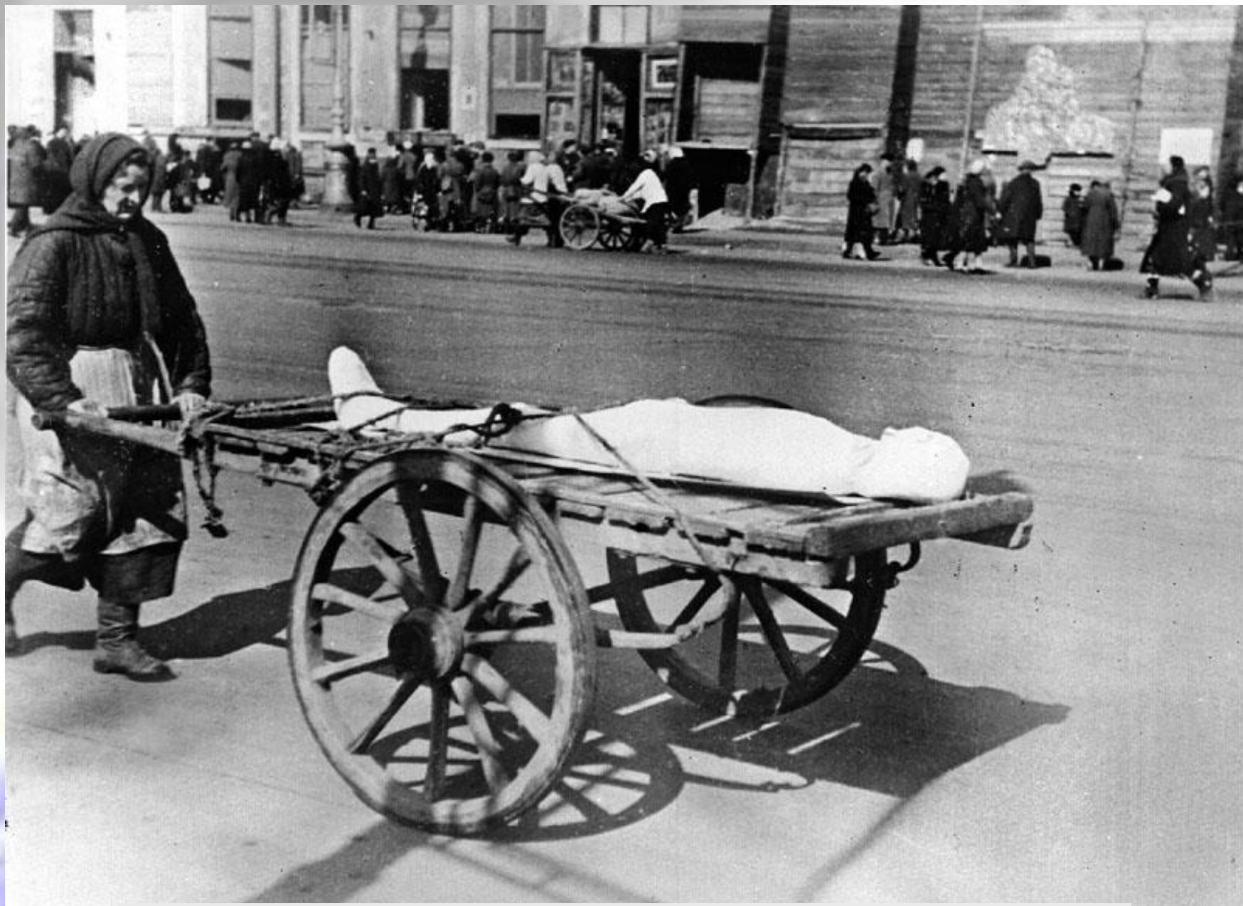
Женщина везет умершего в дни блокады Ленинграда