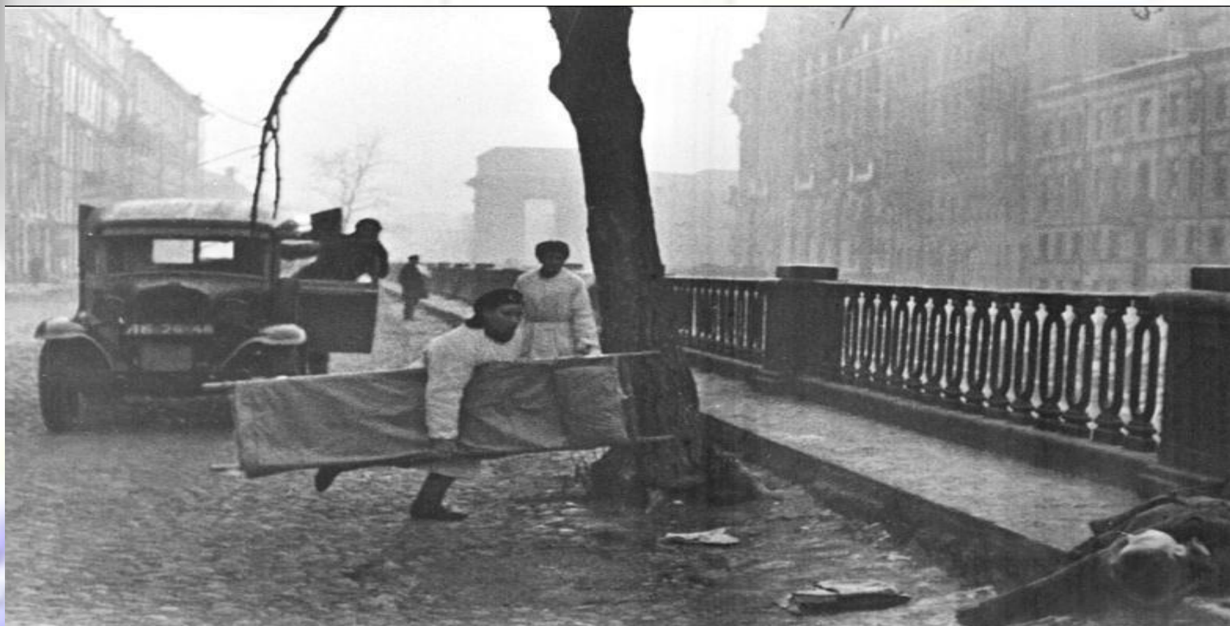
Во время артобстрела Ленинграда

На момент начала блокады в Ленинграде находились 2 миллиона 544 тысячи человек, в том числе около 400 тысяч детей. Эвакуацию осуществить не успели: начались бомбардировки и обстрелы, город оказался в кольце врага.