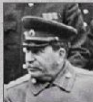
И. В. Сталин (СССР)