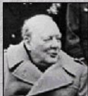
У. Черчилль (Великобритания)