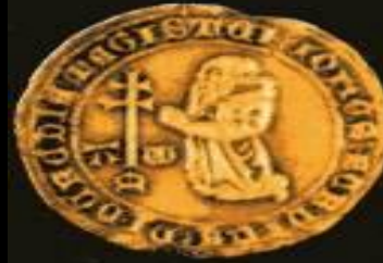
Печать Фердинанда Эредна, великого магистра госпитальеров ордена Святого Иоанна Иерусалимского (1384 г.). Орден, уже оставивший Иерусалим (1187 г.), Сен-Жанд'Акр (1291 г.), а затем и Кипр, с 1309 года расположился на острове Родос.