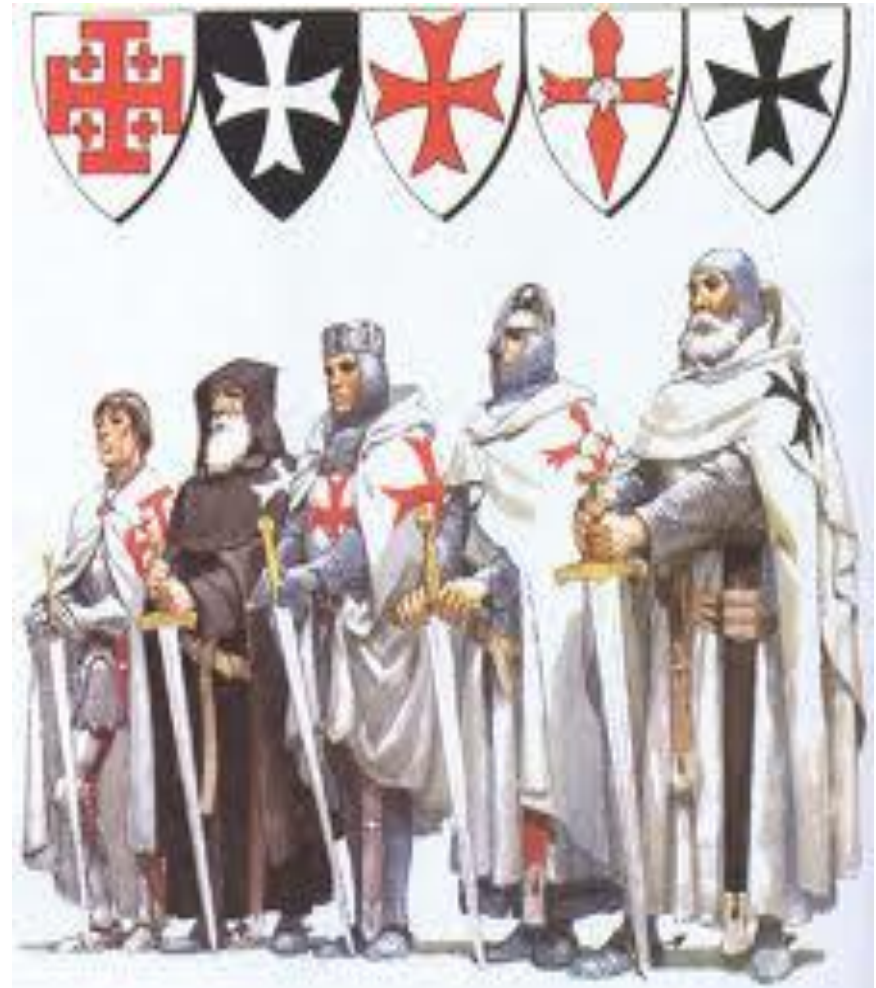
Орден Святого Иона Иерусалимского

Мальтийский орден был основан в Средние века как монашеско – рыцарский орден. Его члены видели свою миссию в том, чтобы лечить и защищать паломников в Святую землю. Поскольку рыцарям приходилось часто сражаться, чтобы отстоять свои владения, Орден приобрел довольно воинственные черты.