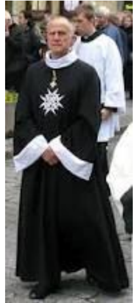
Почетный рыцарь Мальтийского Ордена: XXI век

Родившись, как военизированная религиозная структура, Мальтийский орден к нашему времени превратился в гражданскую и по преимуществу светскую организацию. Большинство рыцарей ордена не принадлежат к религиозным структурам.