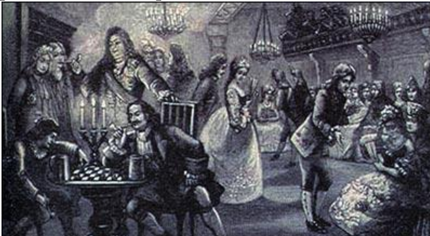
Игра в шахматы на ассамблее при Петре I

● Из Европы царь привез и новые формы общения и развлечения : праздники с фейерверками, маскарады. С 1718 г. специальным указом он ввел ассамблеи , устраиваемые попеременно в домах знати