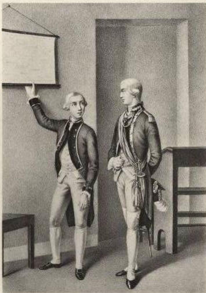
КАДЕТЪ И ОФИЦЕРЪ

Артиллерійскаго и Инженернаго Корпуса 1784-1786.