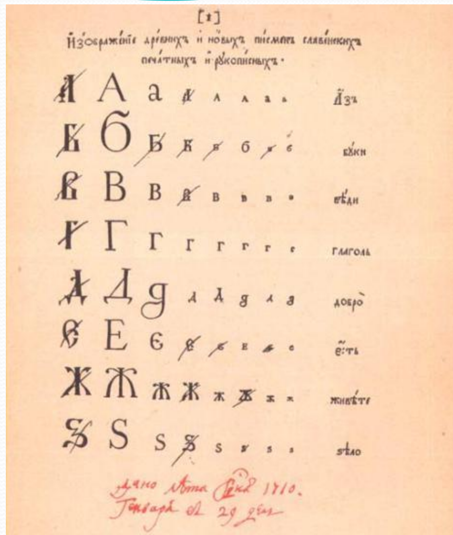
Образец гражданской азбуки, исправленный Петром...

● Большое значение для повышения уровня грамотности населения имело введение в 1710 г. гражданской азбуки . Как отмечал позже М.В. Ломоносов, «при Петре Великом не одни бояре и боярыни, но и буквы сбросили с себя широкие шубы и нарядились в летние одежды».