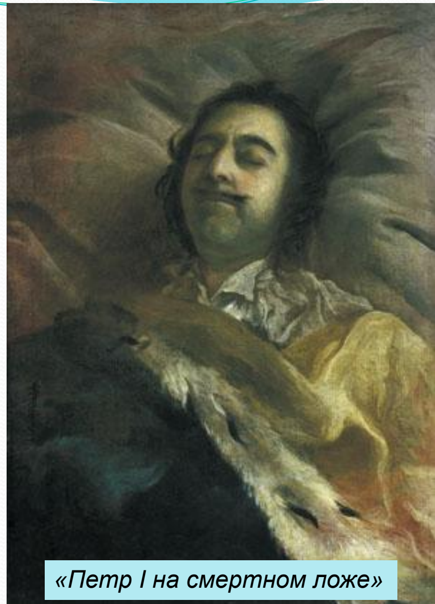
«Петр I на смертном ложе»

● Популярность приобрела портретная живопись . Основоположником русской светской живописи является Иван Никитич Никитин , обучавшийся в Италии. Его кисти принадлежат работы: « Напольный гетман », « Петр I на смертном ложе ». Ему присуще правдивое изображение героев, интерес к внутреннему миру человека, показ не только индивидуальных внешних черт, но и характера.