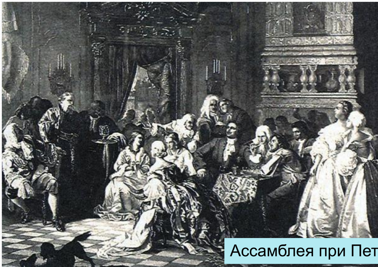
Ассамблея при Петре I. 1858 г

Распространение получила игра на клавикордах (прототип пианино), скрипке, флейте. Появляются любительские оркестры, на концерты которых в обязательном порядке должны были ходить представители знати.