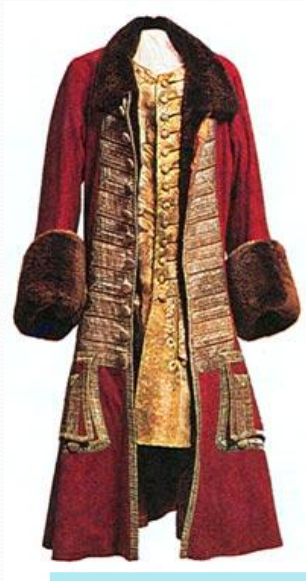
Зимний кафтан Петра I