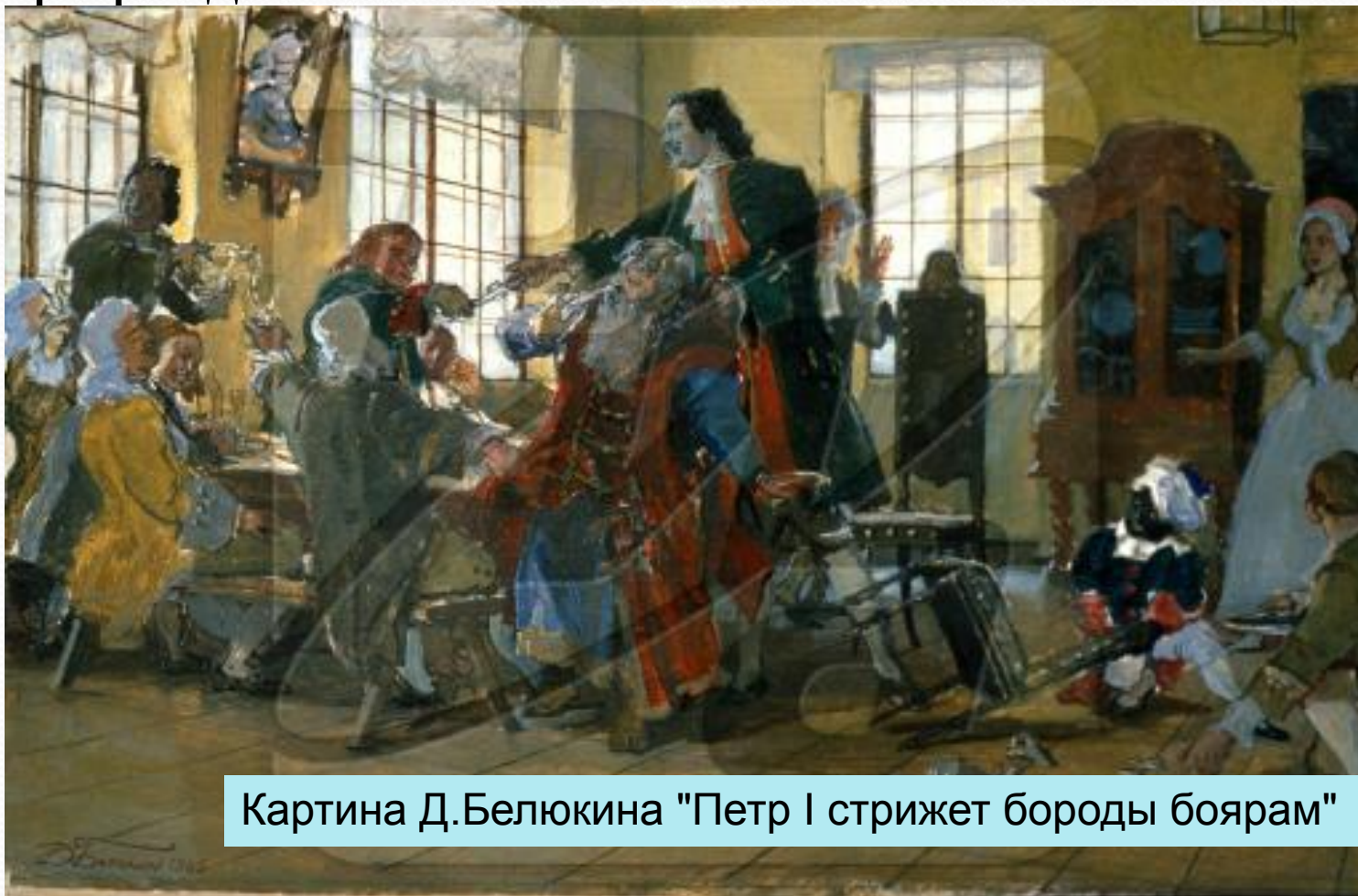
Картина Д.Белюкина "Петр I стрижет бороды боярам"