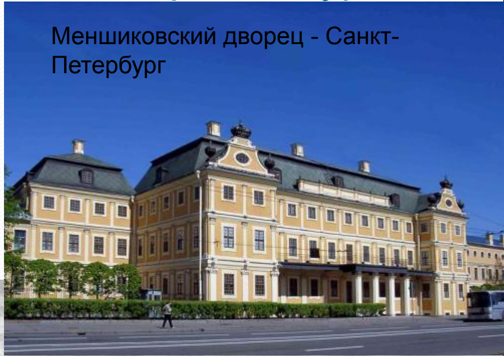
Меншиковский дворец - Санкт-Петербург

● Петропавловский собор и Петропавловская крепость, здание Двенадцати коллегий, Меншиковский дворец в Петербурге, Меншикова башня в Москве, первые сооружения в Петергофе.