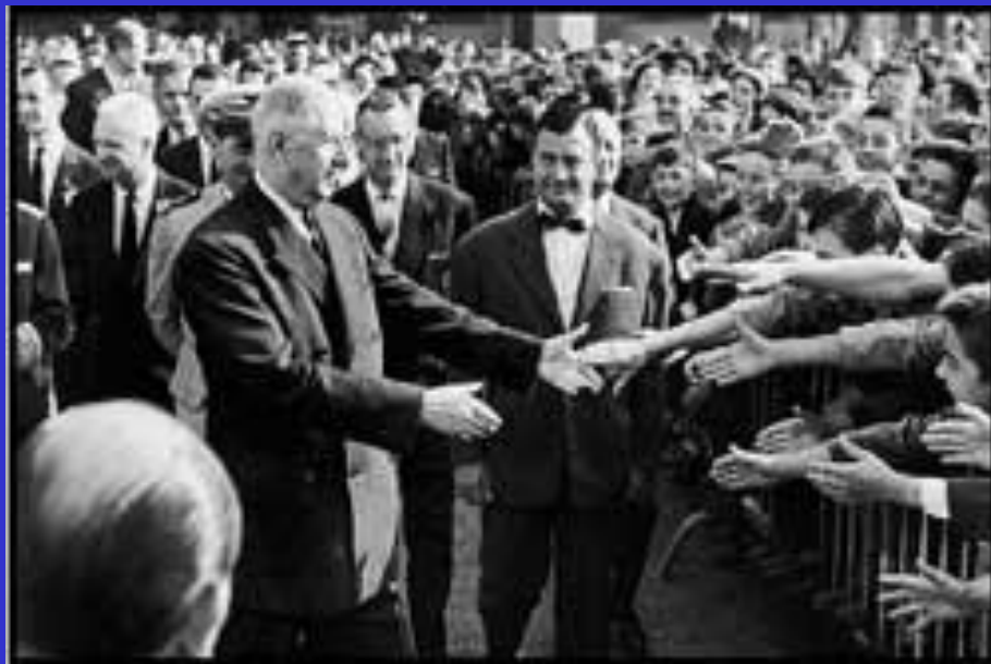
Французы приветствуют Шарля де Голля

В послевоенной Франции расставились политические силы, определявшие Французская Коммунистическая партия (ФКП), Социалистическая партия (СФИО), Католическая партия и Народно-республиканское движение (МРП). В октябре 1945 г. состоялись выборы в Учредительное собрание, победу на которых одержали левые силы, которые активно участвовали в Движении Сопротивления. Во главе сформировавшегося правительства стал Шарль де Голль. В 1946 г. была принята новая Конституция, которая знаменовала собой установление во Франции Четвёртой республики.