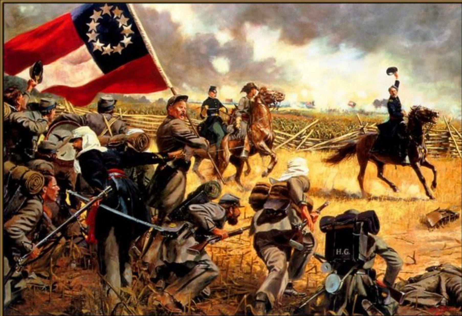
"Up Alabamians" The 4th Alabama at First Bull Run, July 21 1861