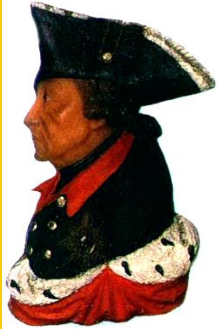
Фридрих II- Король

Международные отношения в 18в. были очень запутанны и противоречивы. Пруссия, возглавляемая Фридрихом II Великим начала захватнические войны. В ходе борьбы за австрийское наследство Фридрих захватил Силезию и стремился подчинить Саксонию, Чехию, часть Польши. Он полагал что ослабшая Франция не станет мешать.