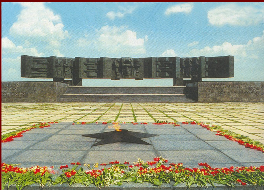
Мемориальный комплекс «В честь героев Курской битвы» (624 км автомагистрали Москва—Симферополь)