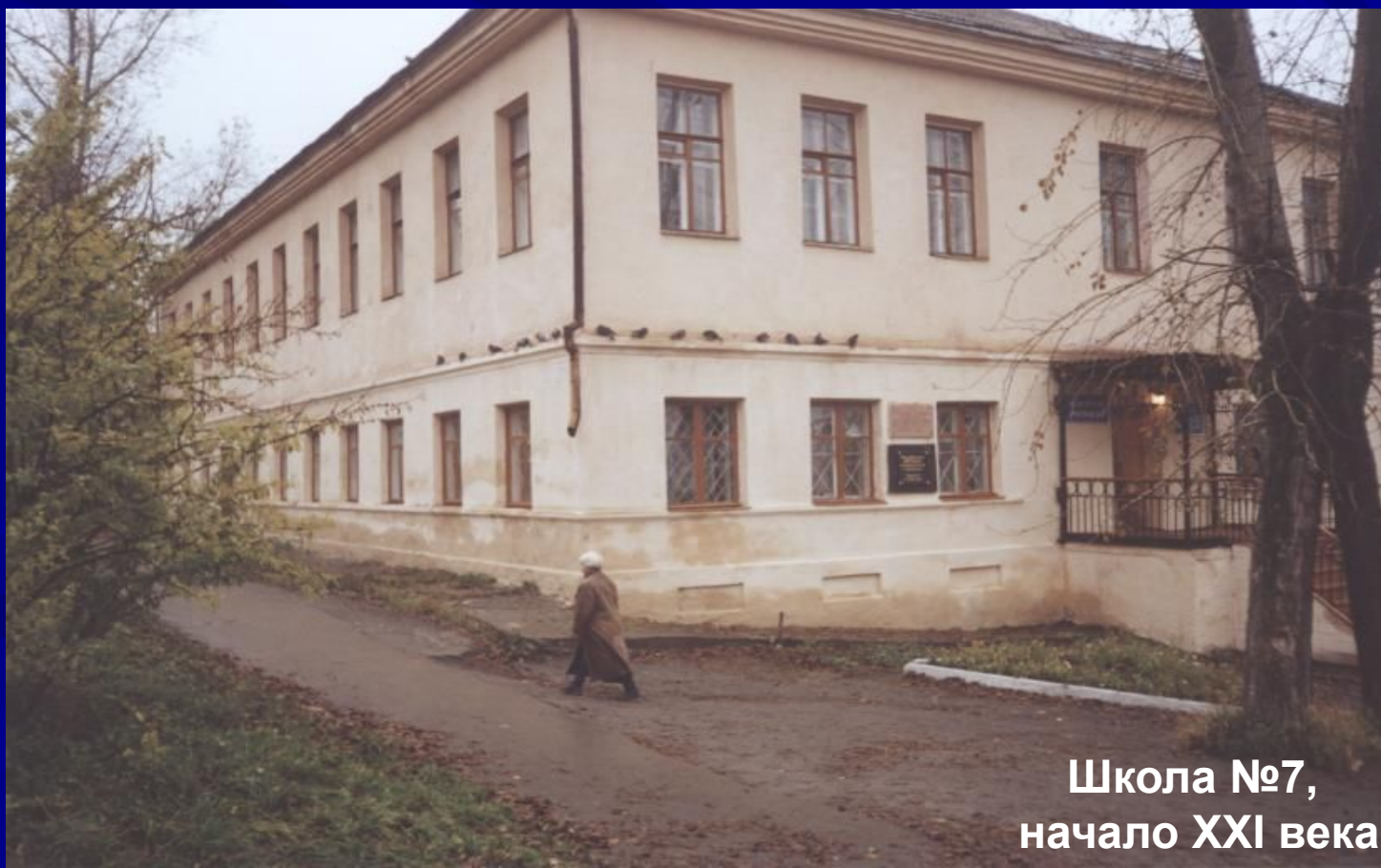
Школа №7, начало XXI века