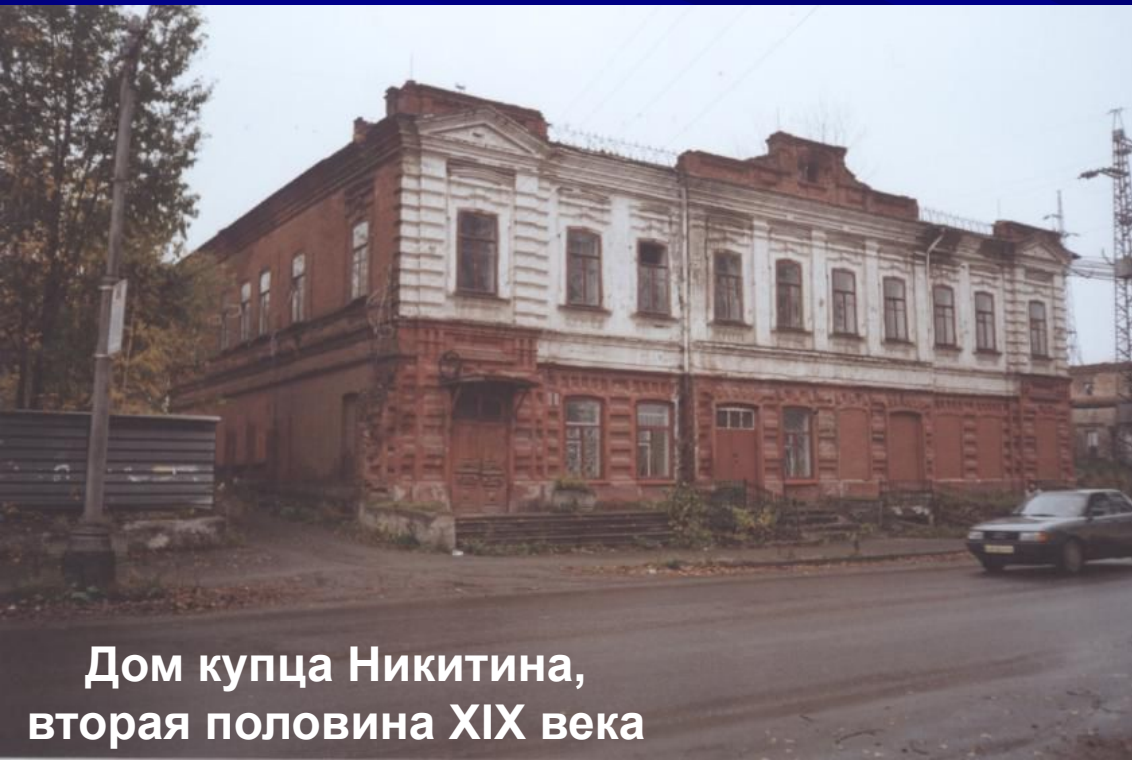
Дом купца Никитина, вторая половина XIX века

Значит, действительно, не бывает дыма без огня, есть правда в народной молве?.. Снова мелькнула тень разудалого купца Никитина, снова запели бубенцы, и лихая тройка с разбегу нырнула в подземелье, скрывшее не одну купеческую тайну.