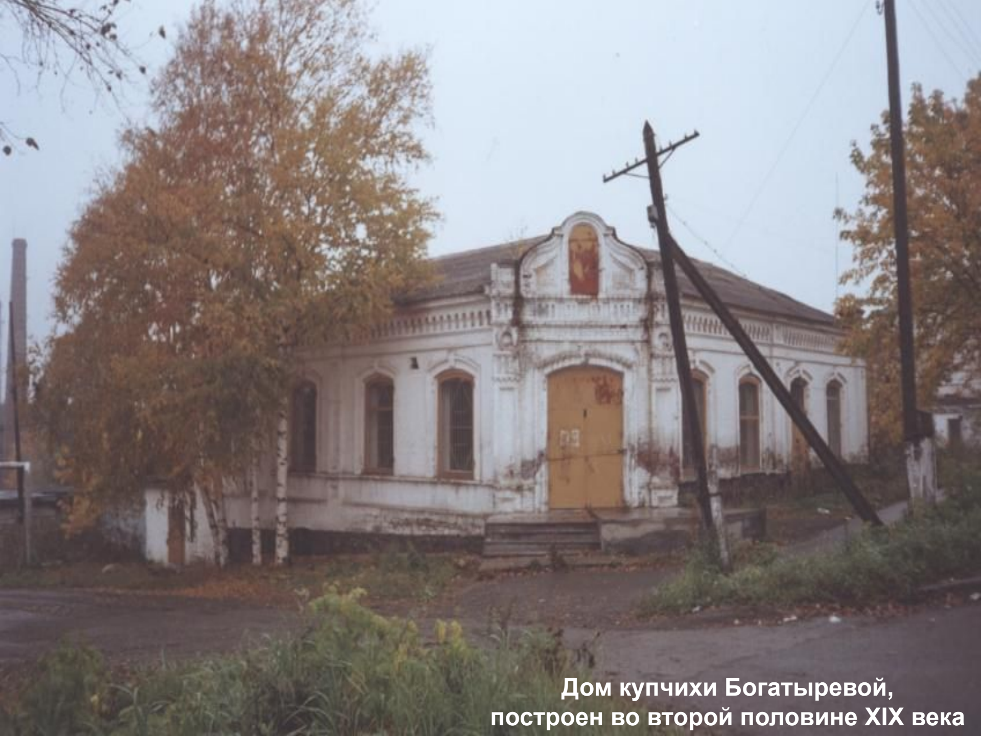
Дом купчихи Богатыревой, построен во второй половине XIX века