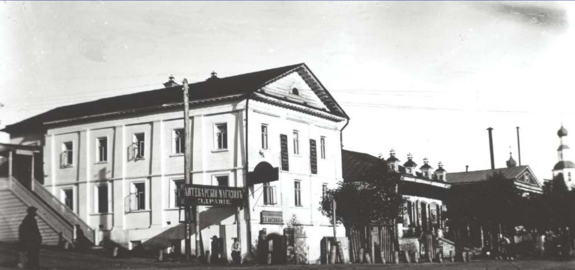
Дом купца Федорова, конец XIX века

Из книги «Национальный Горнозаводской парк Среднего Урала: зонирование, памятники промышленности, архитектуры, истории и культуры, музейное строительство», Екатеринбург, 2000/