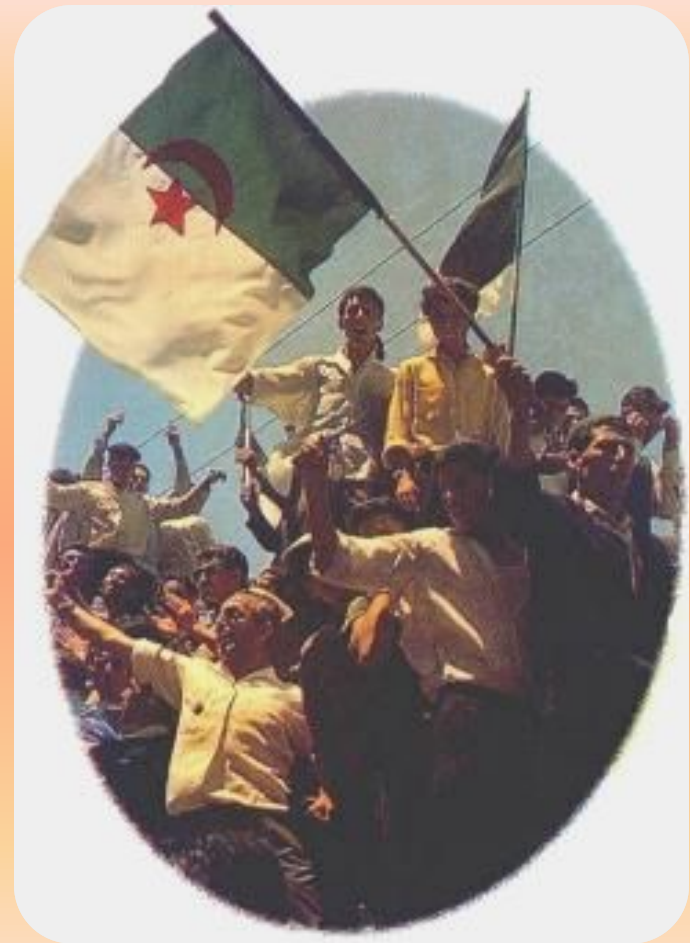
Провозглашение независимости Алжира