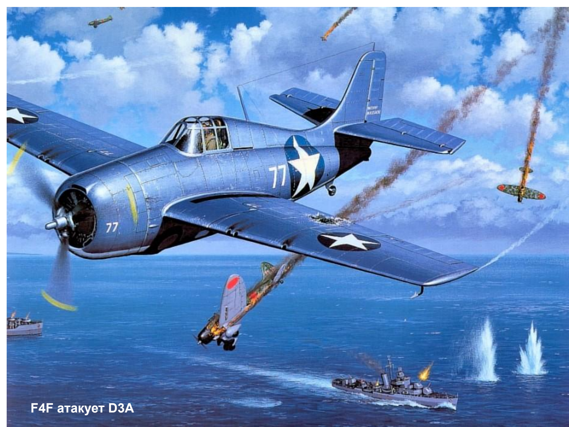
F4F атакует D3A