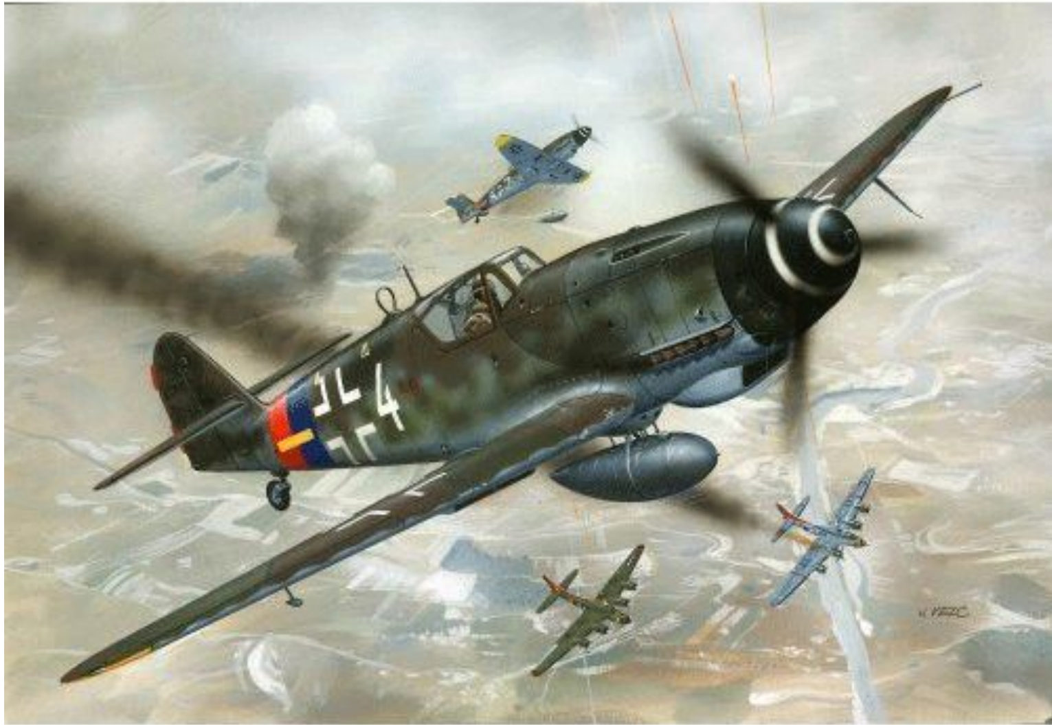
Messerschmitt Bf-109 (G-10)