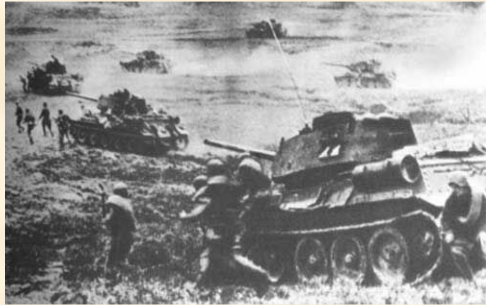
Сражение под Прохоровкой