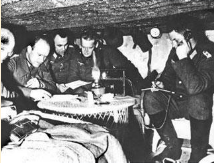
Немецкие офицеры над разработкой операции «Цитадель»

Окончательно похоронило гитлеровскую операцию "Цитадель" крупнейшее за всю вторую мировую войну встречное танковое сражение под Прохоровкой. Оно произошло 12 июля. В нем с обеих сторон одновременно участвовали 1200 танков и самоходных орудий. Это сражение выиграли советские воины. Фашисты, потеряв за день боя до 400 танков, вынуждены были отказаться от наступления.