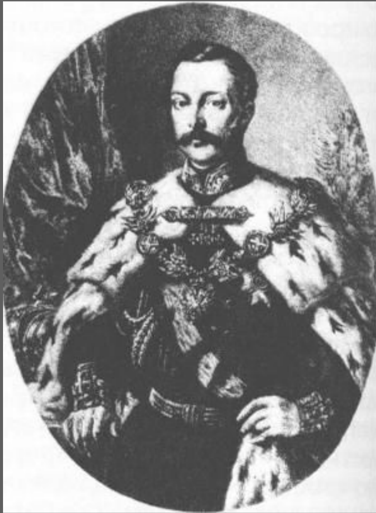
Император Александр II

30.03.1856 г. на встрече с московским дворянством Александр II заявил, что крепостное право лучше отменить сверху, чем ждать, пока оно само собою отменится снизу.