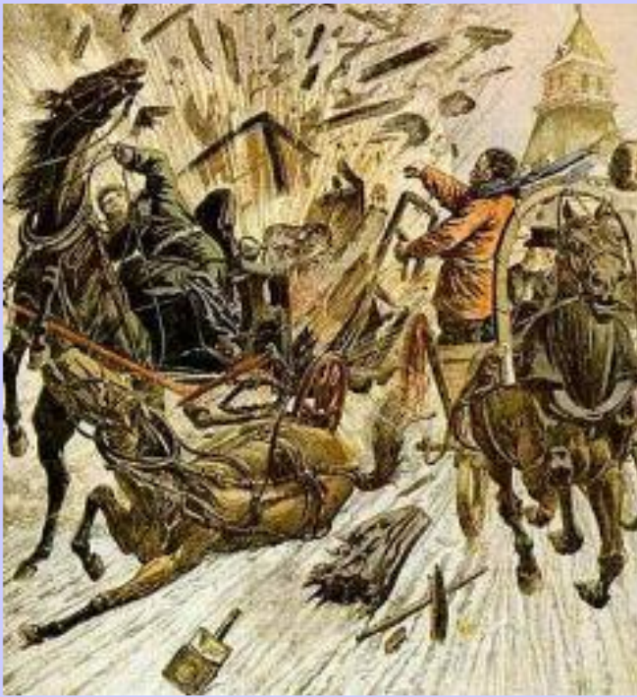
Убийство Великого князя Сергея Александровича

Главное место в программе занимал аграрный вопрос. Частная собственность на землю ликвидировалась. Земля передается в собственность общин Эсеры в качестве метода борьбы избрали террор. В 1901г. создается Боевая организация. Вскоре ее возглавил Е.Азеф-агент полиции. Уже в начале века эсеры совершили убийства В.Плеве и Великого князя Сергея Александровича, а также ряд др. террористических актов.