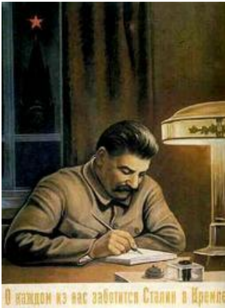
Плакат 1932 г.

Характерной чертой политической жизни этого периода стал культ личности И. Сталина. 21 декабря 1929 г., в день 50-летия Сталина, страна узнала, что у нее есть великий вождь. Он был объявлен «первым учеником Ленина». Вскоре Сталину стали приписывать все успехи страны. Он именовался «великим», «мудрым», «вождем мирового пролетариата», «великим стратегом пятилетки».