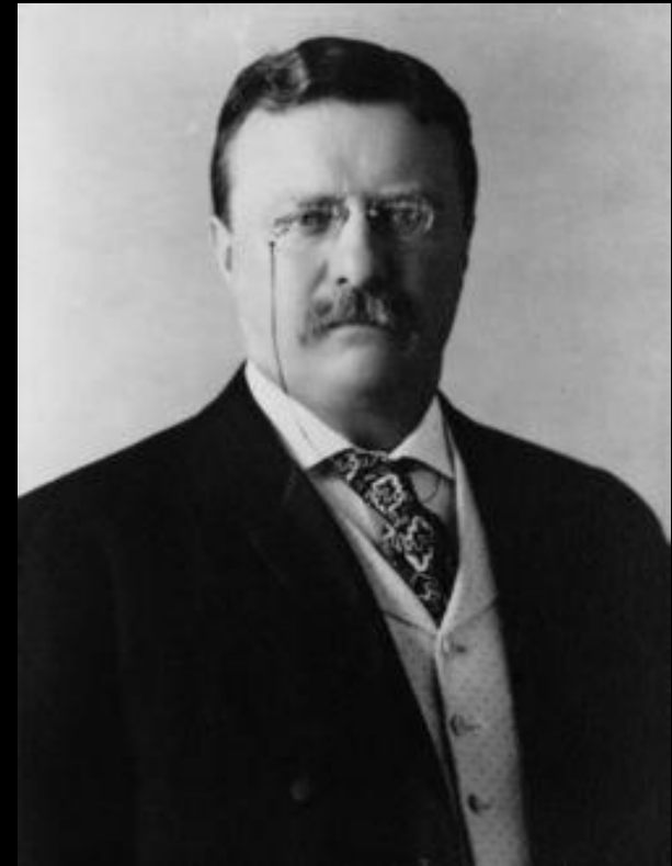
Теодор Рузвельт 1901-1909

■ Политика большой дубинки (англ. Big Stick Policy) — расширенное толкование Теодором Рузвельтом доктрин Монро в отношении стран Латинской Америки. Была декларирована в 1904-05 гг. Предполагала, что если в Латинской Америке возникнут конфликты, то США обеспечат их урегулирование, в том числе и с использованием военной мощи. Впервые этот термин появился в речи Т. Рузвельта (тогда ещё вице-президента, за несколько дней до убийства Мак-Кинли), произнесенной им 2 сентября 1901 г. на ярмарке в штате Миннесота, где президент процитировал западноафриканскую пословицу: «Говори тихо, но держи в руках большую дубинку, и ты далеко пойдешь»