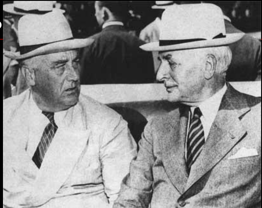
Франклин Рузвельт и Кордел Хэлл