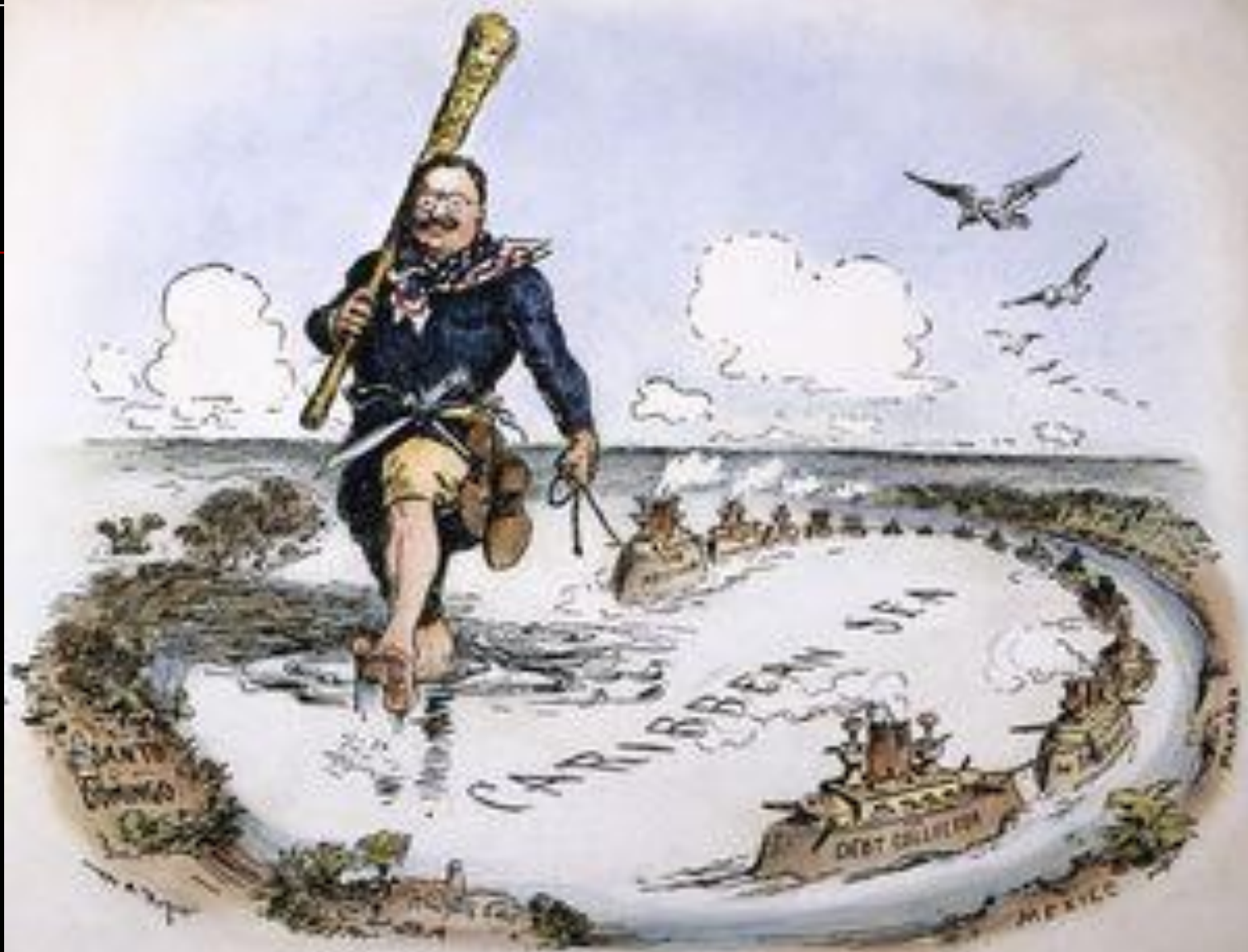
THE BIG STICK IN THE CARIBBEAN SEA