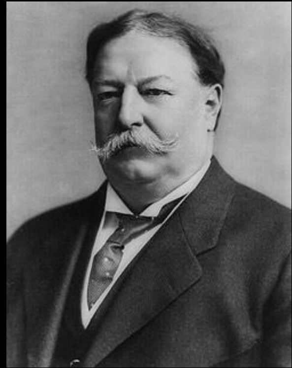
Уильям Говард Тафт