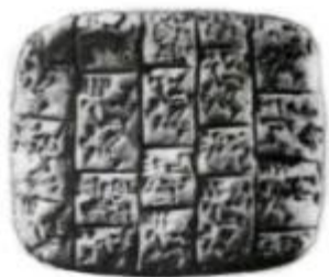
Глиняная клинопис- ная табличка.