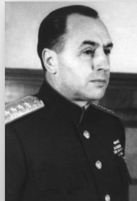
Алексей Антонов, заместитель начальника Генерального штаба РККА, ведущий разработчик плана операции

С немецкой стороны — в составе группы армий «Центр» — 850—900 тыс. человек (включая примерно 400 тыс. в тыловых частях).