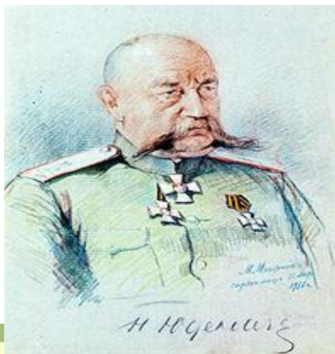
Генерал Н. Н. Юденич