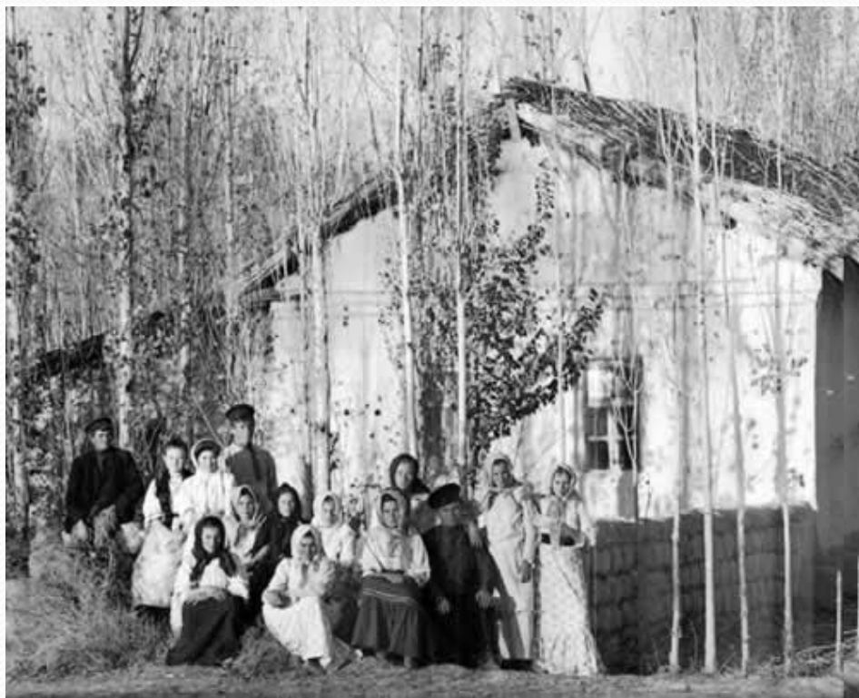
Русские переселенцы в Самаркандской губернии Туркестанского генерал-губернаторства.

● Важнейшим направлением реформы стала переселенческая политика. Борясь с перенаселением в центре страны, Столыпин стал раздавать земли в Сибири на Дальнем Востоке и Средней Азии предоставляя переселенцам льготы (освобождение на 5 лет от налогов и воинской службы). Но местные власти отнеслись к этому враждебно. Почти 20% переселенцев возвратились назад. Правда население восточных районов все же заметно увеличилось.