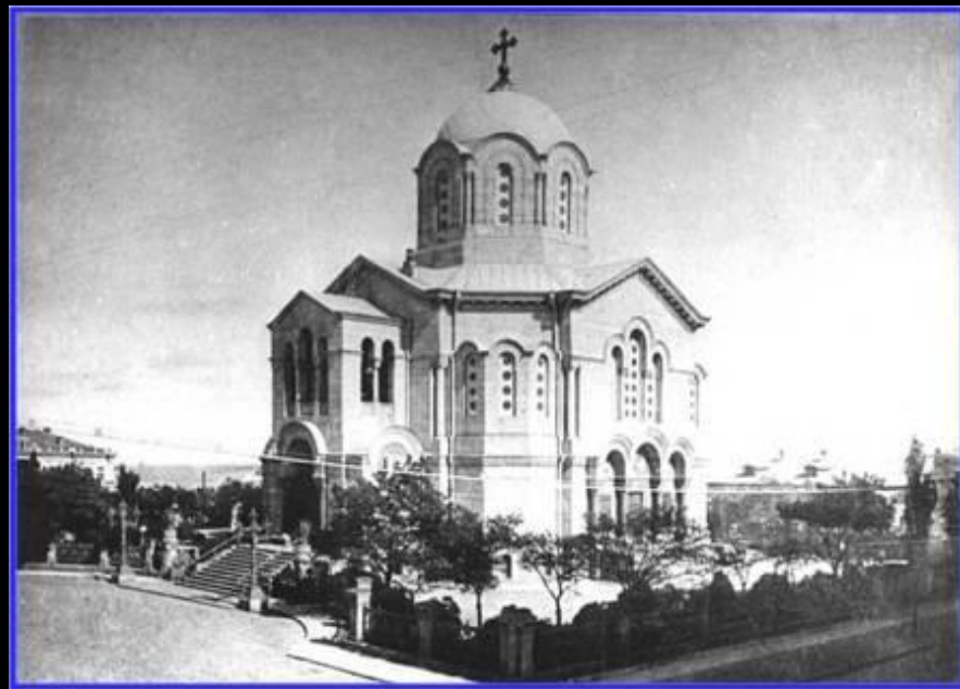
Владимирский собор (1854-1888 гг.) Архитектор К.А. Тон)