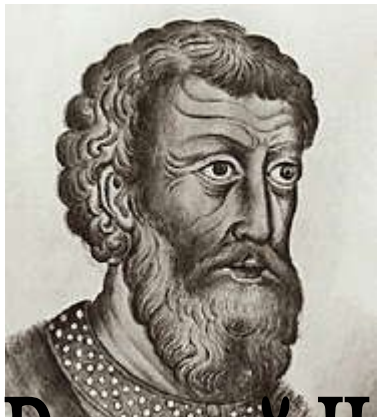
Василий II 1425-1462