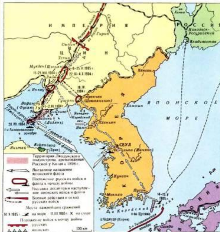
Русско-Японская война 1904-1905 гг.