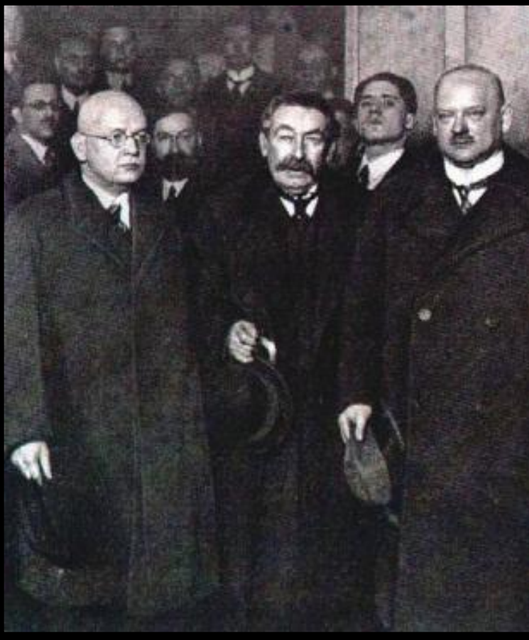
Аристид Бриан. (в центре).

Появилось огромное количество теорий о том как преодолеть кризис. Социалисты предлагали ликвидировать капитализм, националисты-установить господство над другими народами. В 1928 г. был подписан пакт Бриана-Келлога, запрещавший войну. Его гарантировали Лига наций и США. К сер.30-х пакт подписали 63 государства.