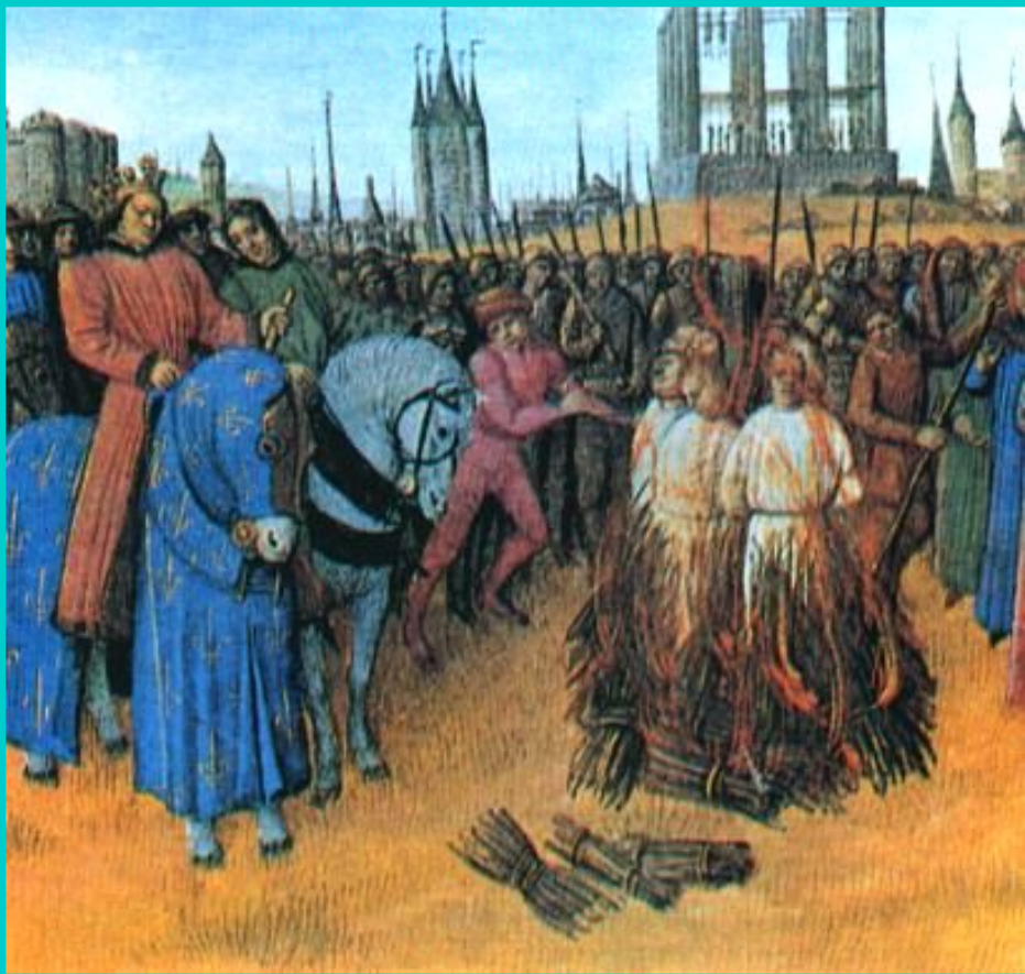
Сожжение еретиков. Средневековая миниатюра.

За 10 лет его «великого инквизиторства» на кострах сгорели 10 000 людей.