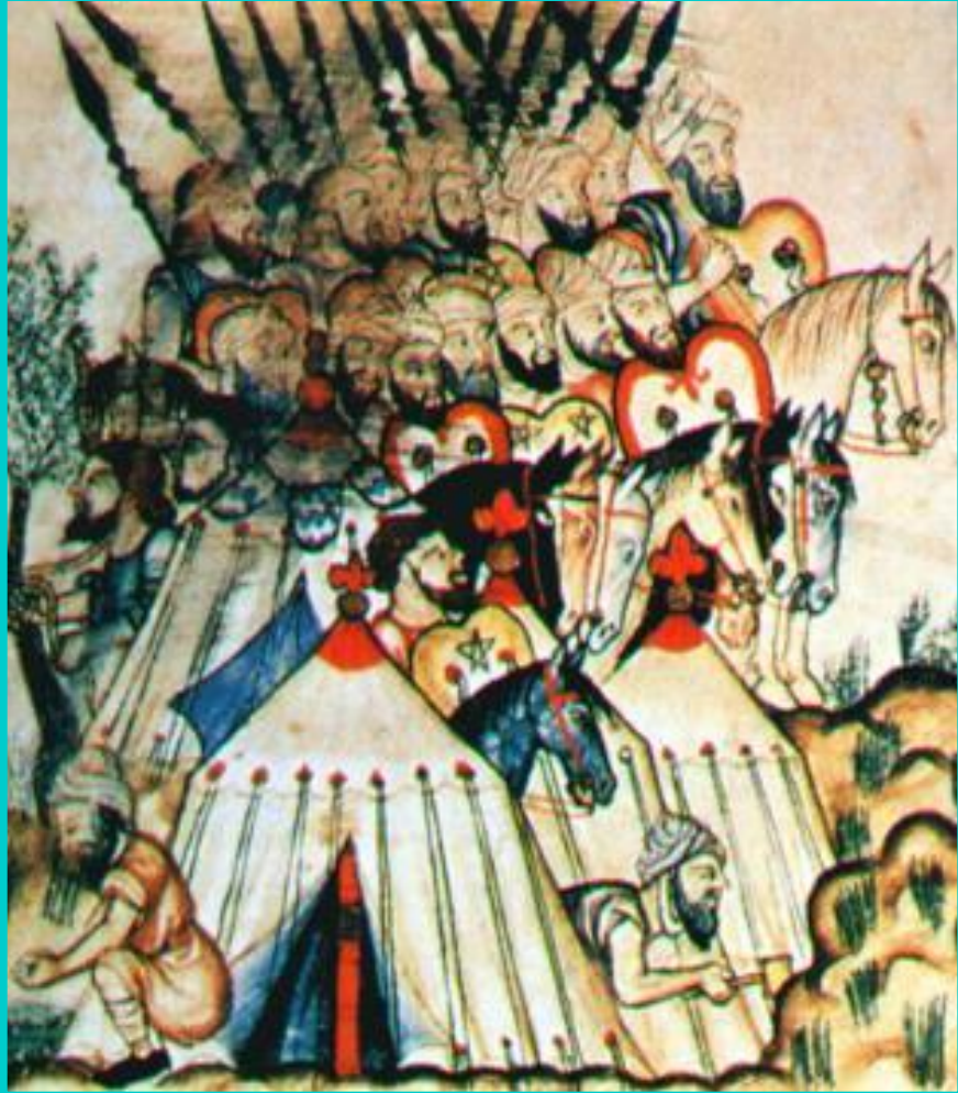
Войско мавров. Средневековая миниатюра.

Испанцев поддержали итальянцы и французы.