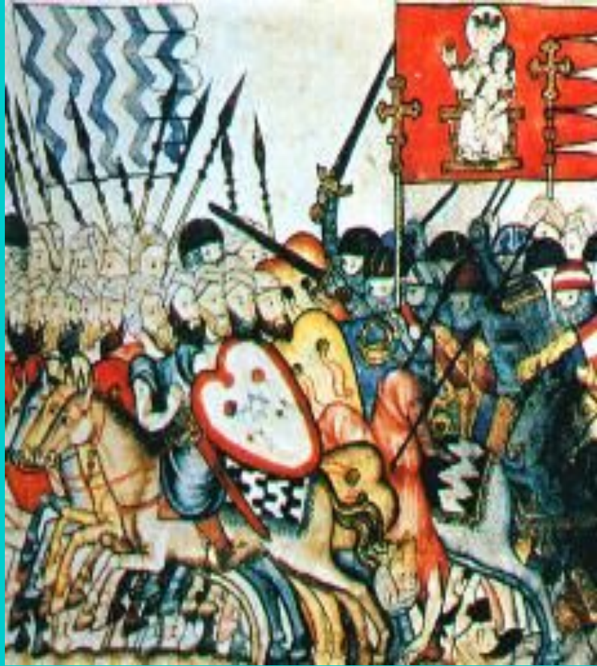
Войско Альфонса X Мудрого в походе. Средневековая миниатюра.

В 10 в в Испании началась Реконкиста -отвоевание земель захваченных му- сульманами.