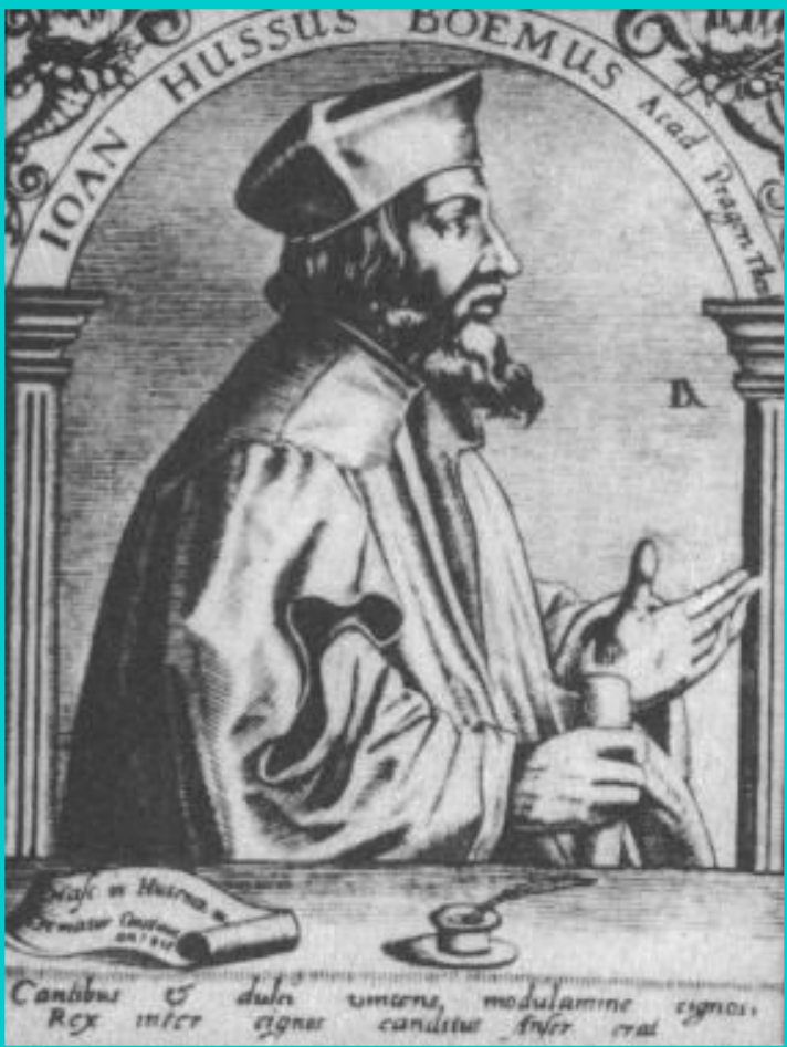
Ян Гус. Гравюра 15 в.

Во главе борьбы с иностранцами встал профессор Пражского университета-Ян Гус-первый чех, выпускник университета.