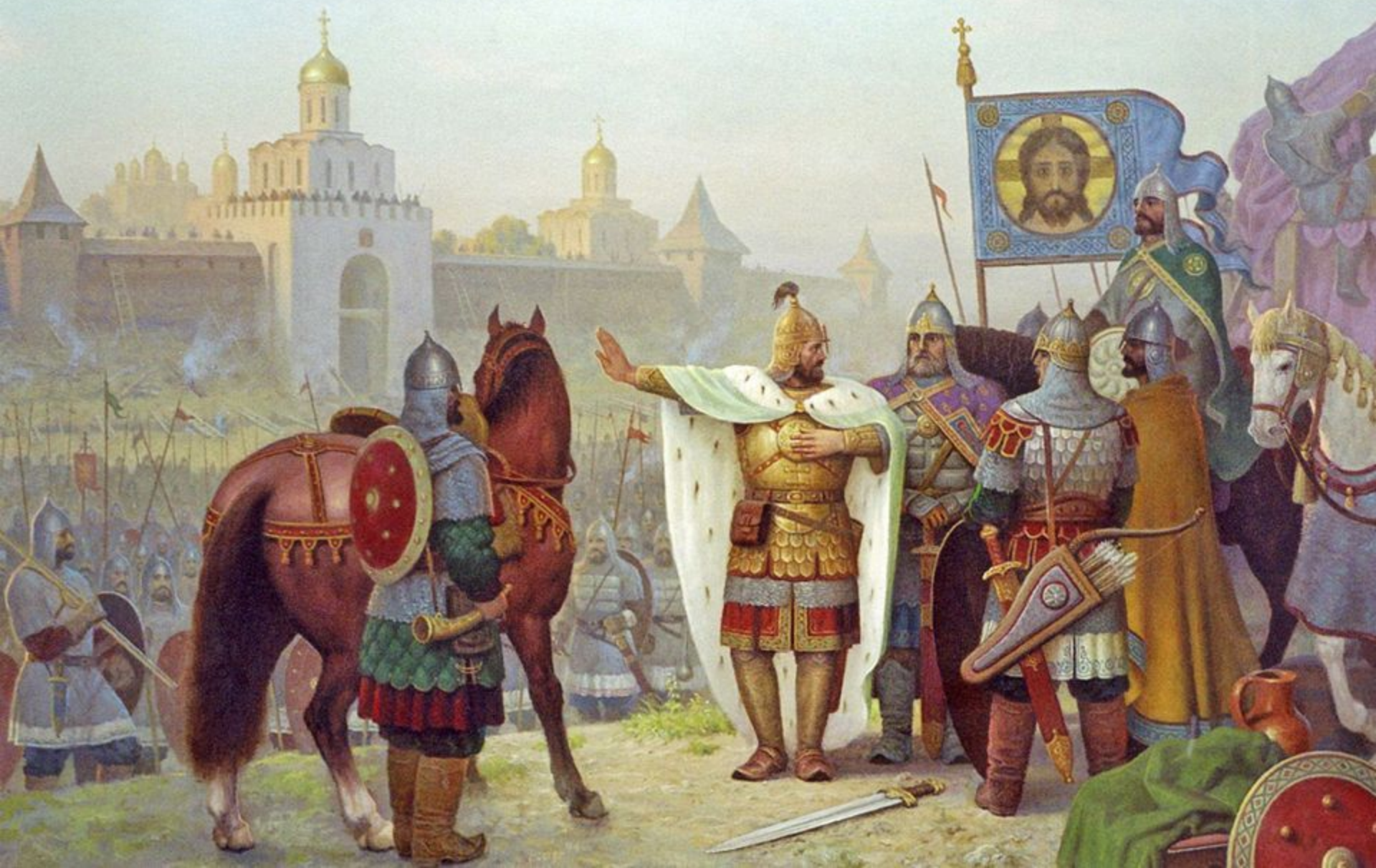
Юрий Долгорукий у стен Владимира.