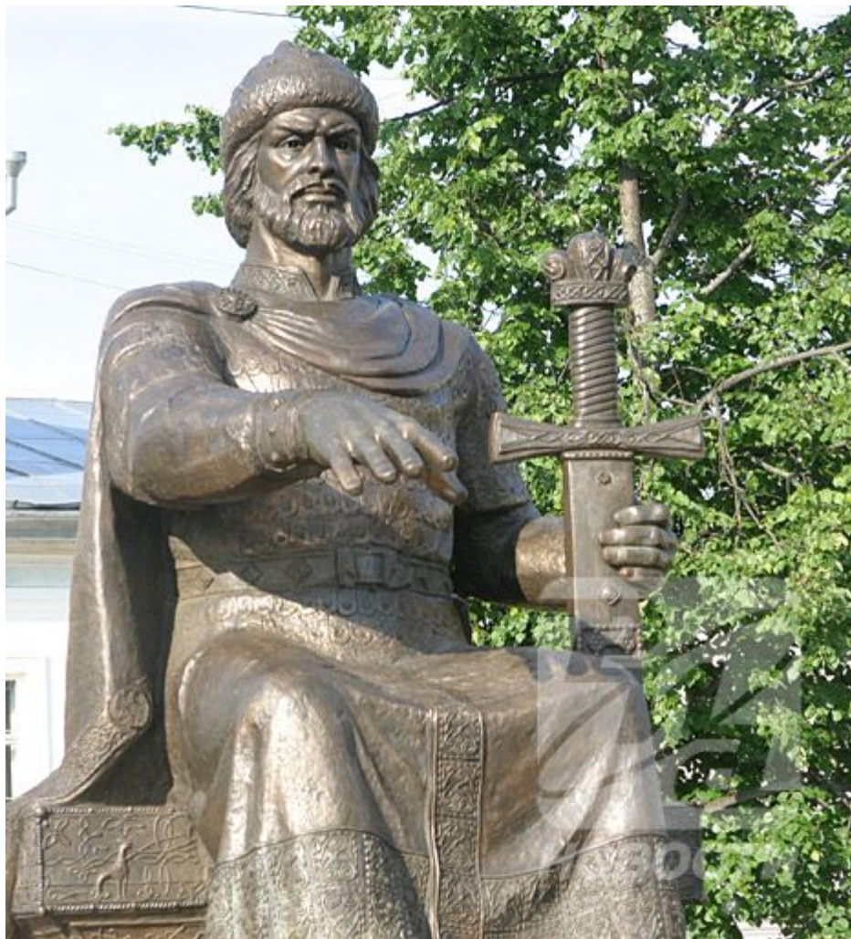
Памятник Юрию Долгорукому – основателю Костромы.