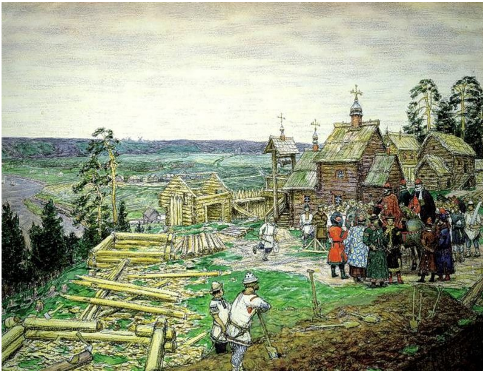
Юрий Долгорукий называет село Кучково Москва.