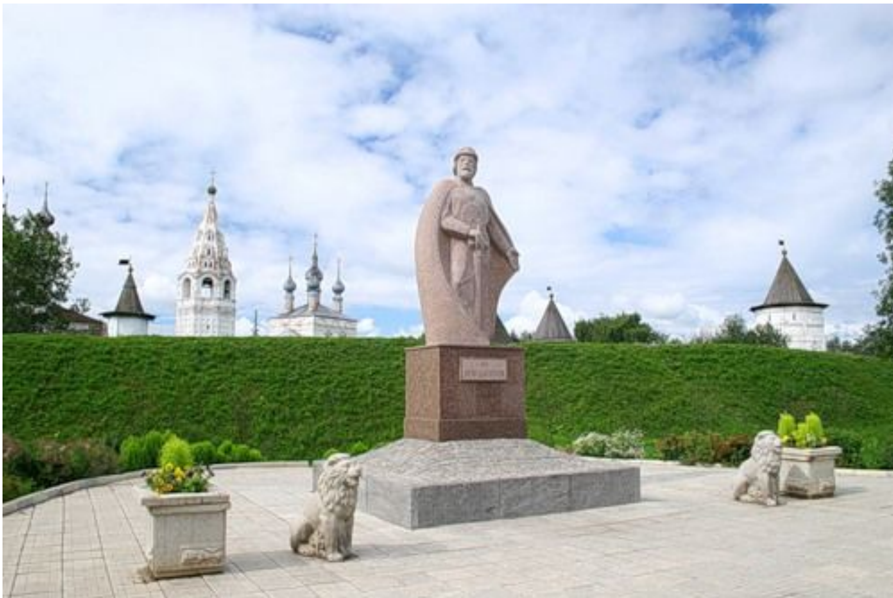
Памятник Юрию Долгорукому - основателю Юрьева-Польского