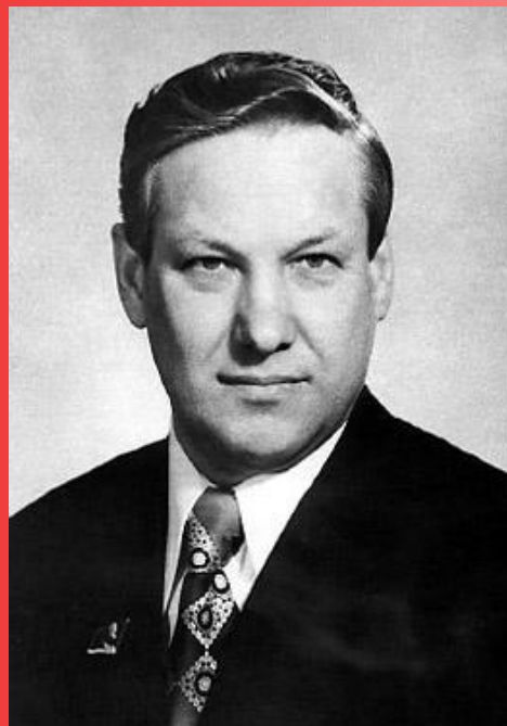
Б.Н. Ельцин (фотография 1970-х годов)

Б.Н. Ельцин родился 1-го февраля 1931 года в трудовой семье. Получил высшее строительное образование, работал на руководящих постах. В 1976 году занял должность первого секретаря Свердловского обкома, а затем стал членом ЦК КПСС. В октябре 1987 года был снят со всех постов из-за своих демократических убеждений. Спустя два года Ельцин был избран народным депутатом СССР и членом Верховного Совета. 12-го июня 1991 года состоялись выборы Президента РСФСР. Главой государства стал Б.Н. Ельцин.