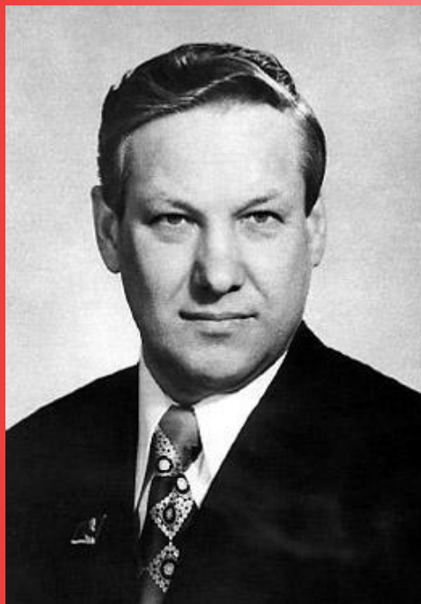
Б.Н. Ельцин (фотография 1970-х годов)

Б.Н. Ельцин родился 1-го февраля 1931 года в трудовой семье. Получил высшее строительное образование, работал на руководящих постах. В 1976 году занял должность первого секретаря Свердловского обкома, а затем стал членом ЦК КПСС. В октябре 1987 года был снят со всех постов из-за своих демократических убеждений. Спустя два года Ельцин был избран народным депутатом СССР и членом Верховного Совета. 12-го июня 1991 года состоялись выборы Президента РСФСР. Главой государства стал Б.Н. Ельцин.