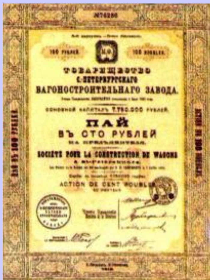
Акция вагоностроительного завода

Развитие банков оказа- лось тесно связано со строительством желе- зных дорог. Это объяс- нялось: