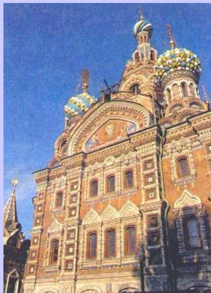
Храм Воскресения Христа на крови на месте убийства Александра II.

10.5.81 Исполнительный Комитет предложил Александру III в обмен на прекращение террора.