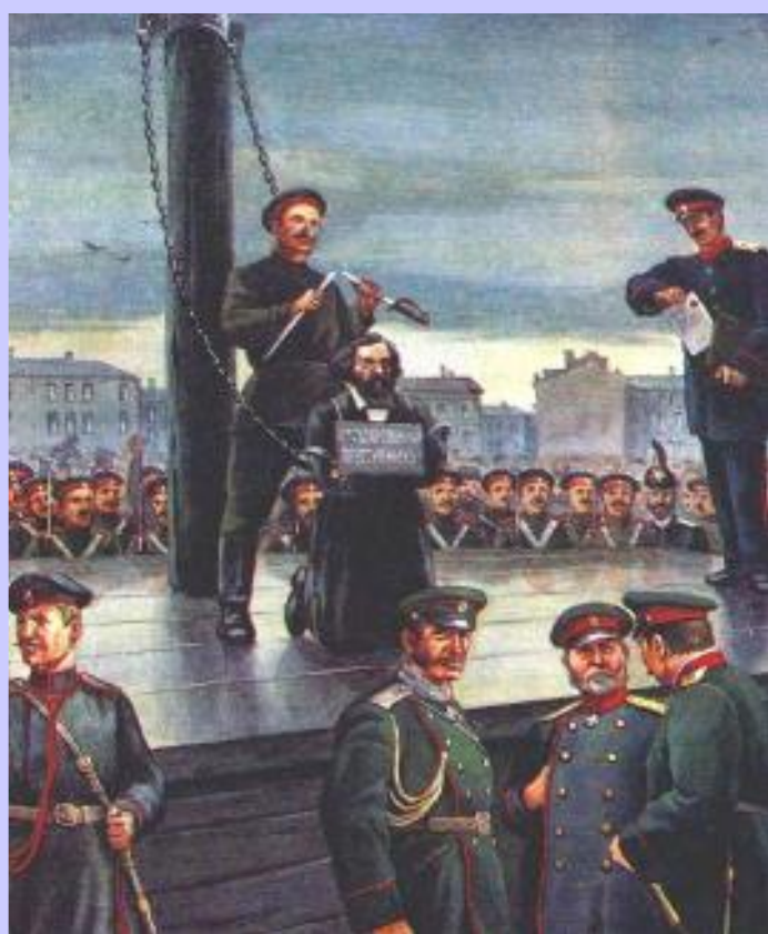
Гражданская казнь Н.Г.Чернышевского

В 1864г. Над ним была совершена гражданская казнь.