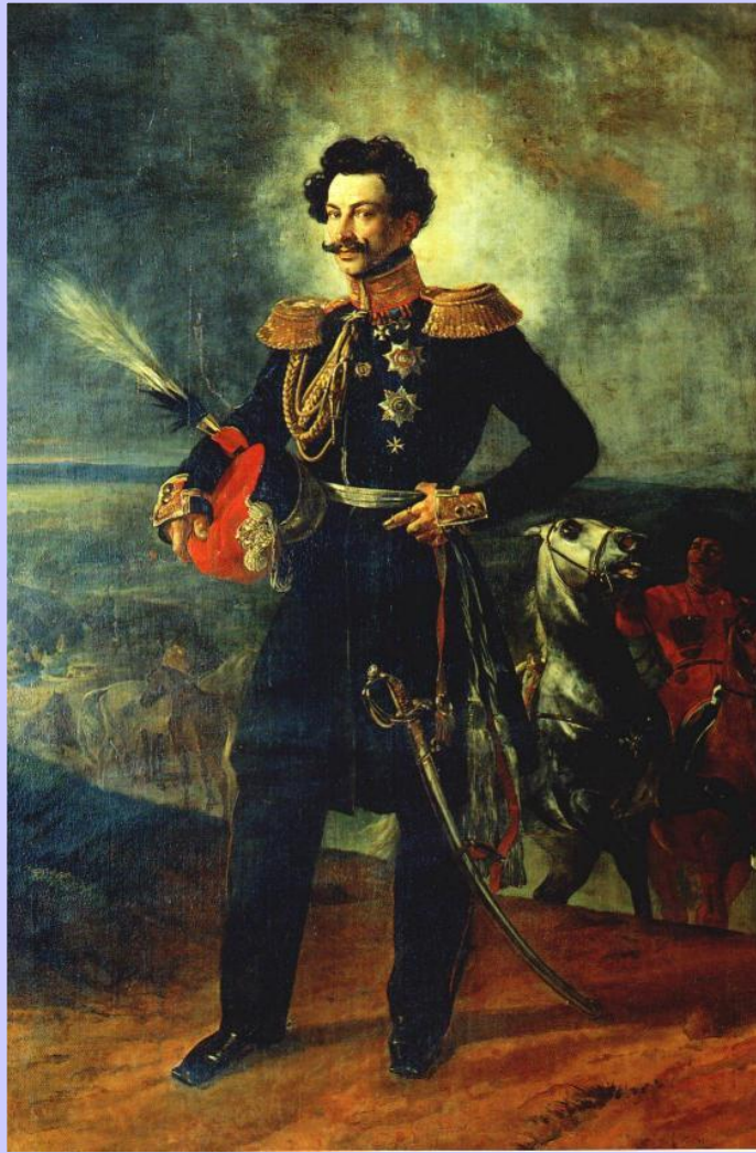
К.Брюллов. Граф В.А.Перовский

В 30-е гг.Россия установила протекторат над казахскими жузами,в этом районе началось строительство укреплений.Но на казахские земли претендовала Хива поддерживаемая англичанами.