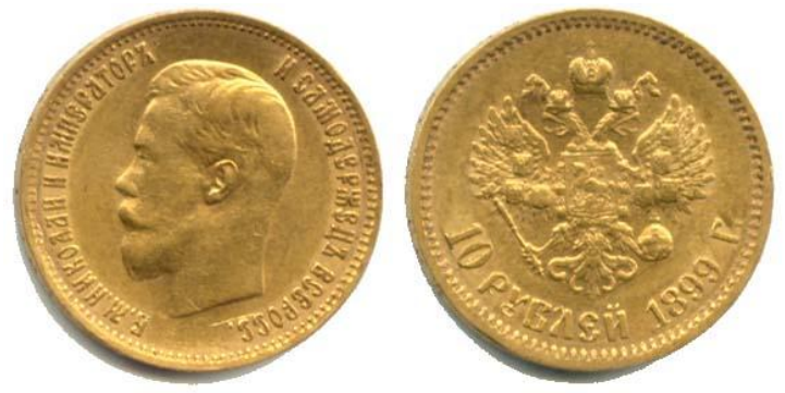
«Николаевский» золотой рубль- имперіал.