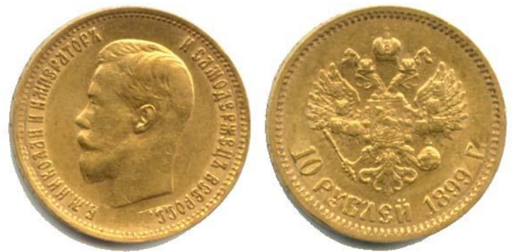
«Николаевский» золотой рубль- имперіал.