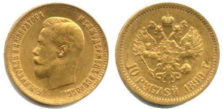
«Николаевский» золотой рубль- империап.