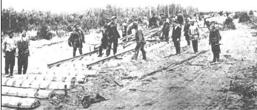
Великий Сибирский путь. — Grand Chemin de la Sibérie. № 45. Укладка пути.