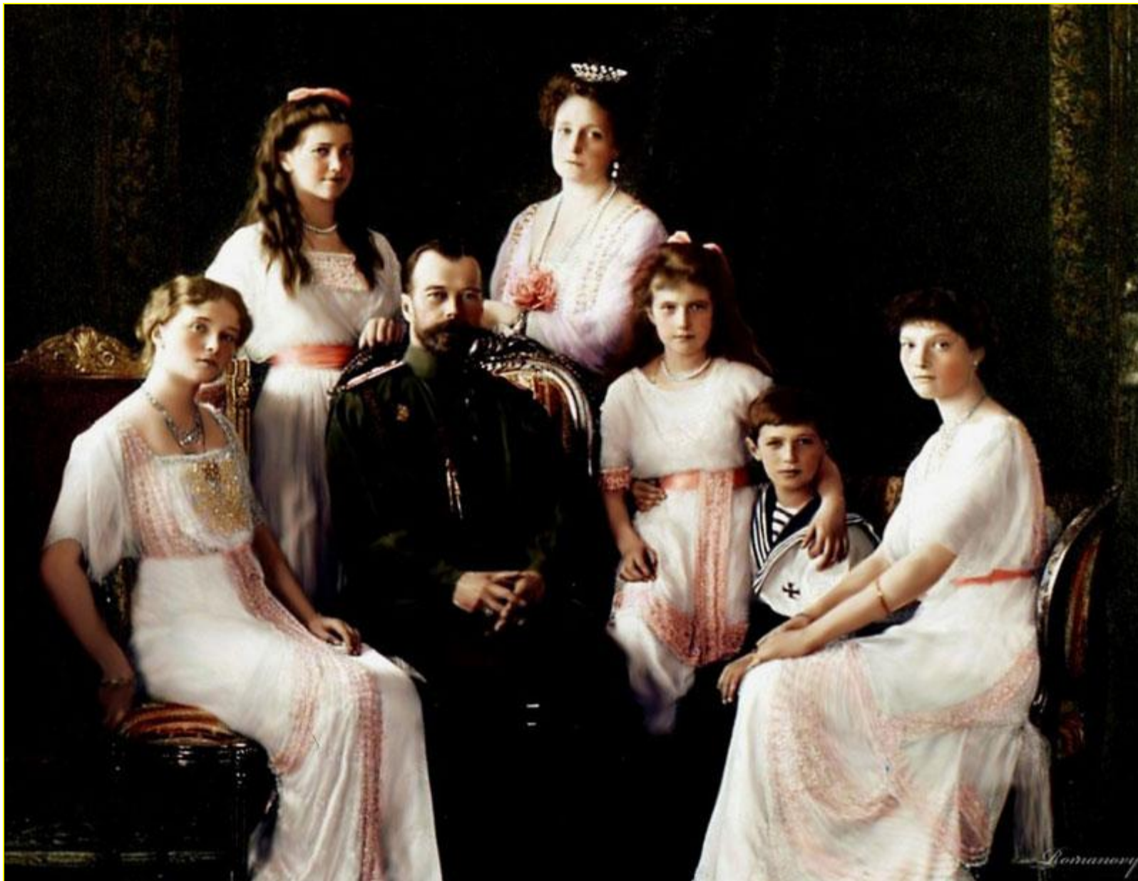
Николай II с семьёй.