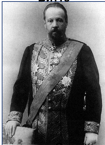
Министр финансов С. Витте