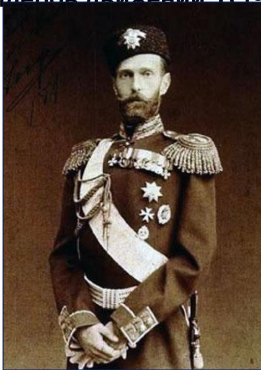
Великий князь Сергей Александрович, губернатор Москвы.

4. Рост рабочего движения привел к попытке власти взять его под контроль . Начальник охранного отделения С.Зубатов пытался внушить рабочим, что положение рабочих может улучшить лишь государство. При поддержке князя Сергея Александровича в Москве и др. городах создаются легальные рабочие организации. Правительство с помощью рабочих не спешило и они начинают участвовать во всероссийских стачках. Зубатова отправили в отставку, а организации разогнали. МВД Плеве начинает внедрять в ряды рабочих агентов с целью выявления лидеров движений. В 1904 г. Плеве был убит революционерами