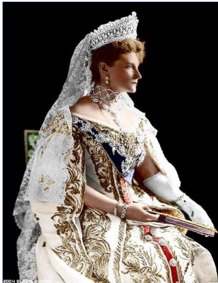
Императрица Александра Федоровна- жена Николая II