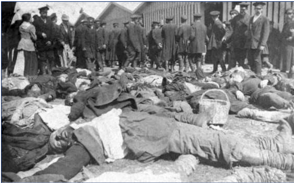
Жертвы Ходынской трагедии