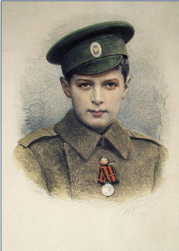
Сын Николая II- Цесаревич и Великий князь Алексей Николаевич. (1904-1918 гг.)

Общество ожидало от нового царя реформ, однако в своей первой публичной речи император заявил, что будет охранять основы самодержавия твердо и неуклонно, как его «незабвенный покойный родитель».