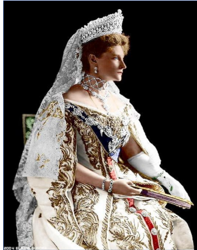
Императрица Александра Федоровна- жена Николая II