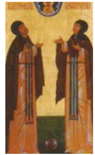
Пётр и Феврония Муромские