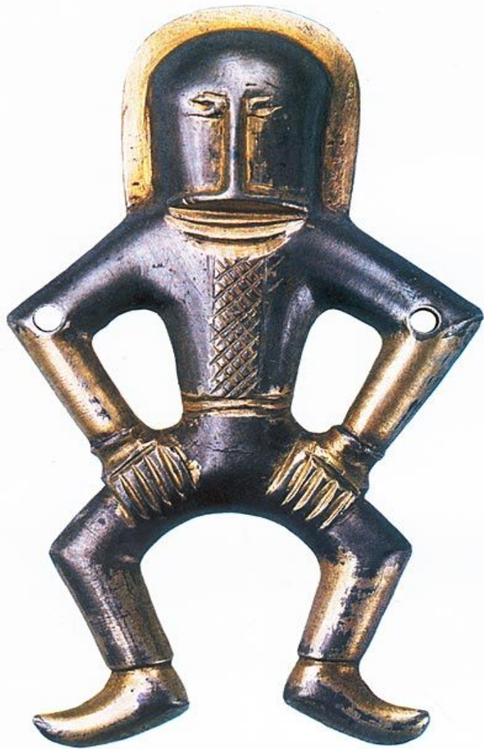
Статуэтка антского воина

После падения державы гуннов вновь наполняются славянским населением дунайские и днепровские берега. В V—VI вв происходит его быстрое и громадное увеличение. Начиная с V в. в бассейнах Днепра и Днестра складывается мощный союз восточнославянских племен, которых называли антами , что на древнеиранском языке означало «жители окраин». Одновременно на севере Балканского полуострова образовался племенной союз склавинов .