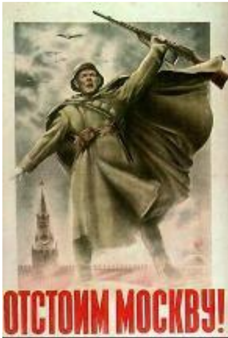
Плакат 1941 г.

Для захвата Москвы был подготовлен план «Тайфун». Немцы попытались достичь на этом направлении 3-кратного превосходства в живой силе и технике. 30 сентября началось генеральное наступление. Под Вязьмой и Брянском советские войска попали в окружение, но сковали действия врага. Оборону Москвы возглавил Г. Жуков. В ноябре враг подошел к городу и в Москве было объявлено осадное положение.