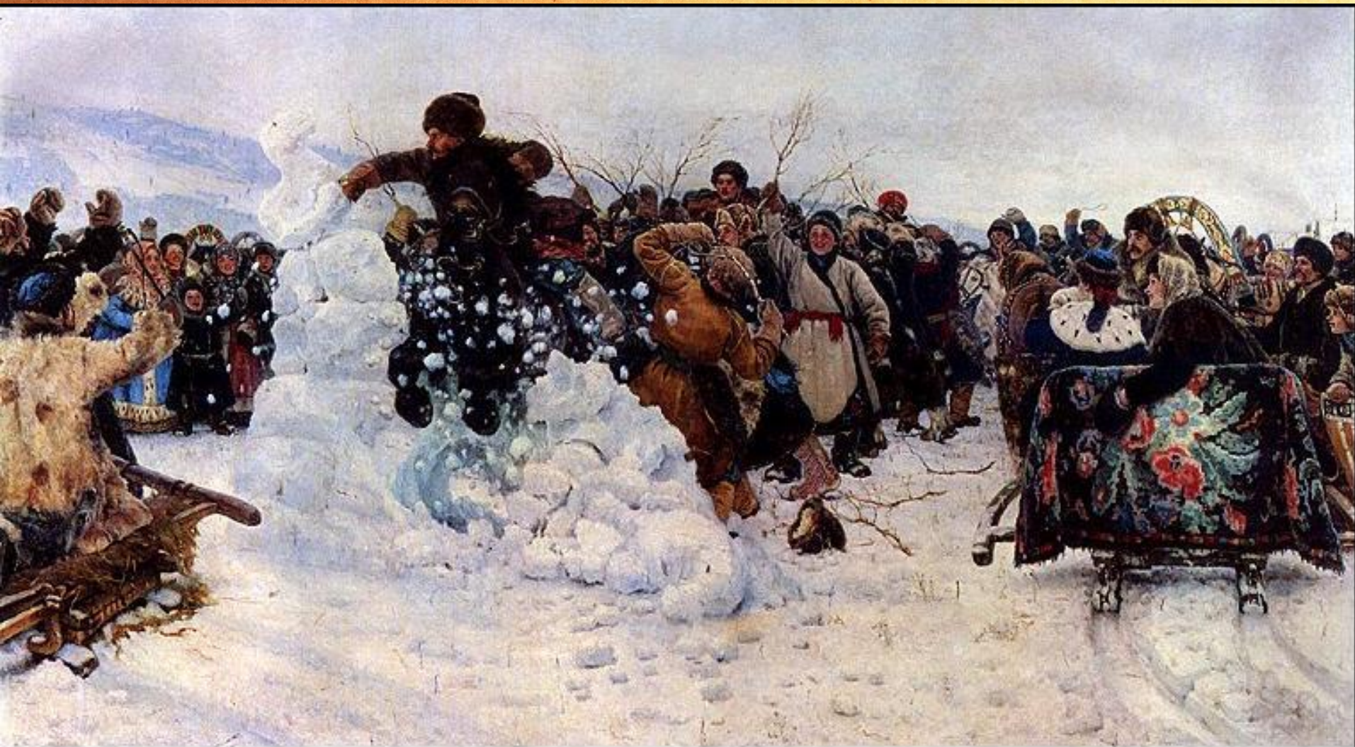
В.И. Суриков. Взятие снежного городка. 1891