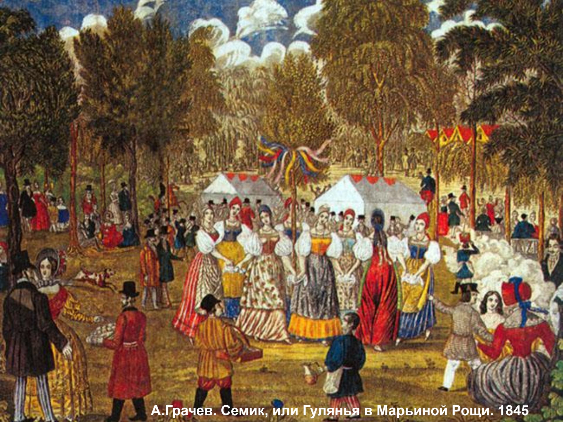
А.Грачев. Семик, или Гулянья в Марьиной Рощи. 1845