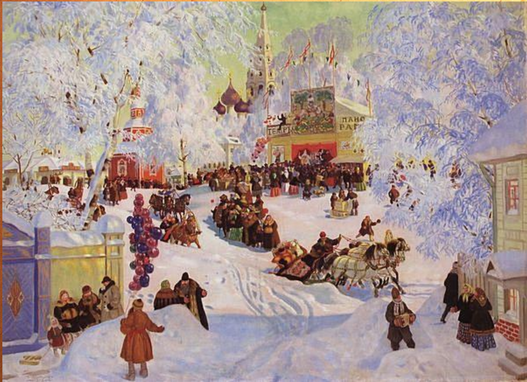
Борис Михайлович Кустодиев. Гулянья на Масленицу.