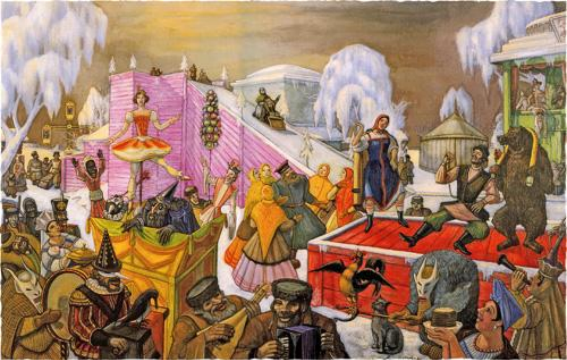
С.Судейкин. Масленица. 1923-1924