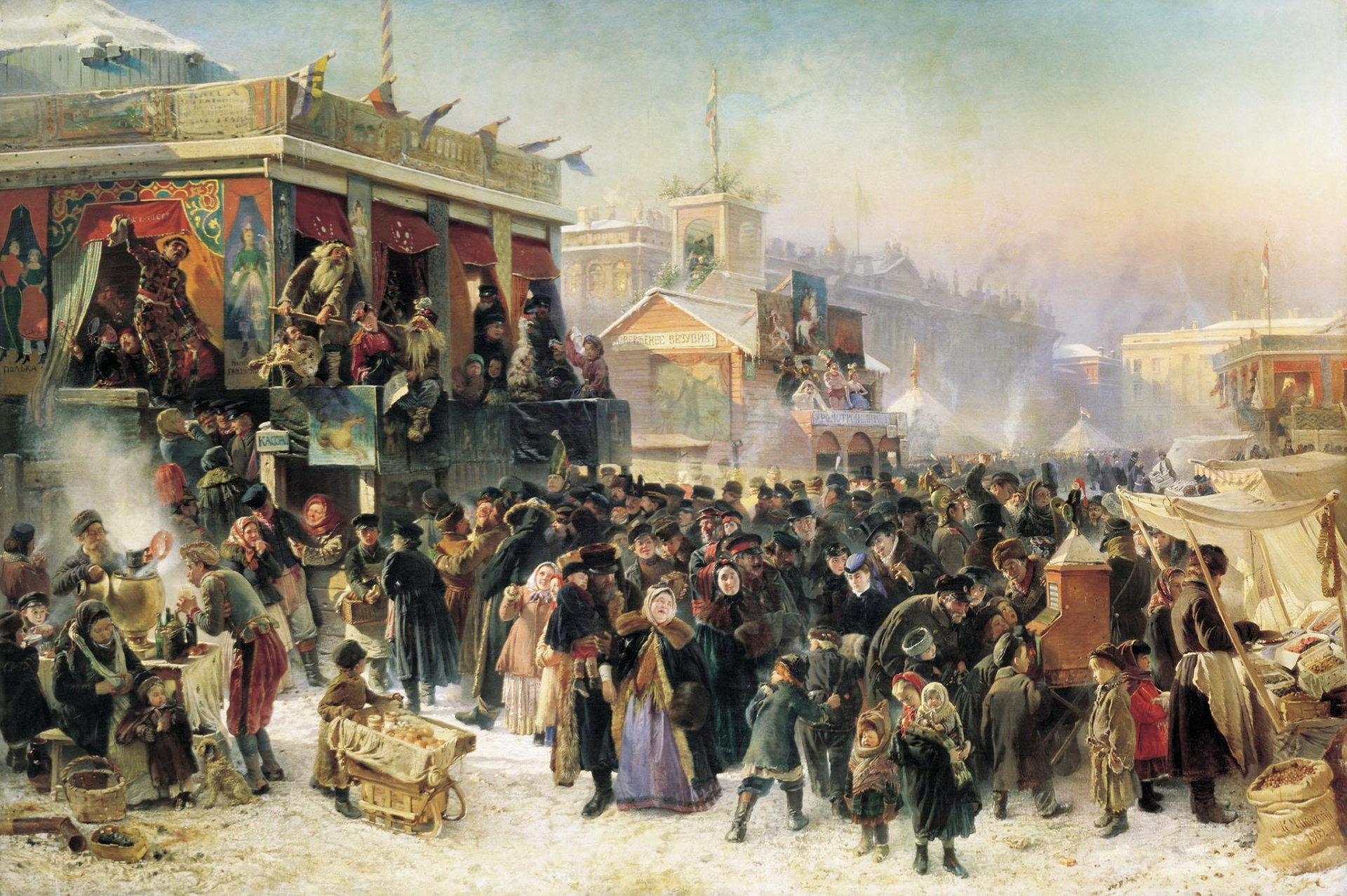
К.Е.Маковский Народное гуляние во время Масленицы на Адмиралтейской площади в Петербурге. 1923-1924.