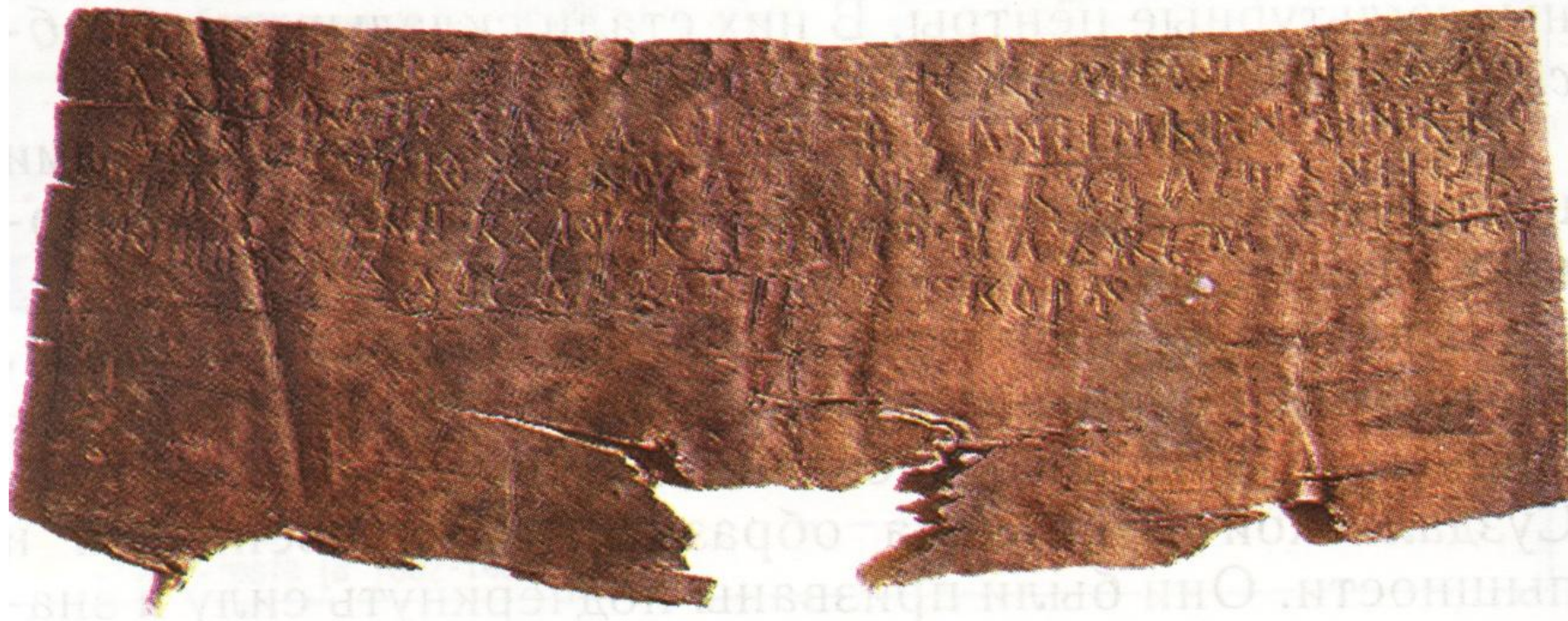
Новгородская берестяная грамота

На Руси было много грамотных людей. Люди обменивались деловой информацией, писали письма. Вместо бумаги пользовались березовой корой – берестой .