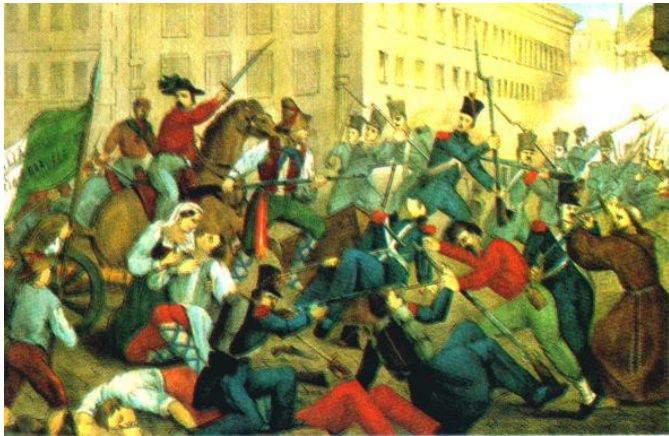
Вступление Гарибальди в Палермо.