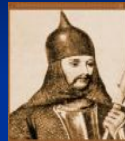
Олег Вещий (Киевская Русь) 912-945