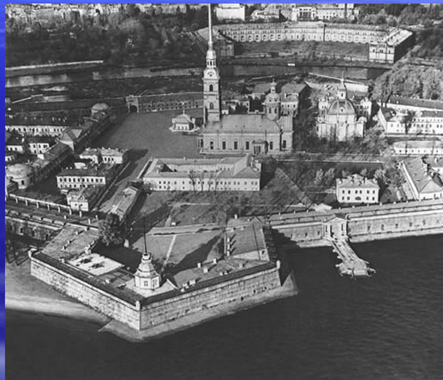
Петропавловская крепость, Нарышкинский бастион и Коммандантская пристань

Работа по строительству древо-земляной крепости руководил А. Д. Меншиков. За возведением каждого из шести бастионов царь приказал следить своим сподвижникам и приближённым. Один из бастионов, юго-восточный, назван в честь самого царя, а другие бастионы до сих пор носят имена его сподвижников: Нарышкинский (с 1726 г. - Екатерининский), Трубецкой, Зотов, Головкин (с 1730 г. - Аннинский), Меншиков (с 1729 г. - Петровский).