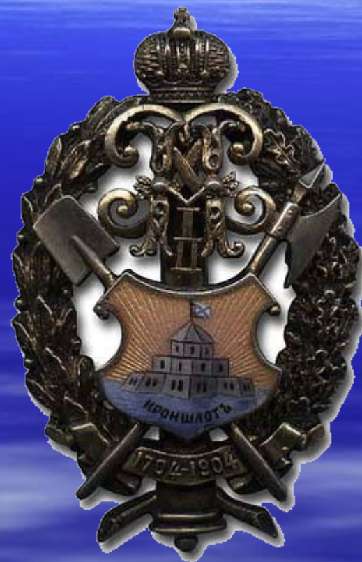
Знак 200 лет крепости Кроншлот

Пётр Первый придавал этой крепости огромное значение. В инструкции коменданту Кроншлота говорилось: «Содержать сию цитадель с Божьей помощью, аще случится, хотя до последнего человека... Зело надлежит стеречься неприятельских брандеров. При приближении к крепости нейтральных кораблей давать по ним предупредительный выстрел, чтобы опустили паруса и бросили якорь; в случае неповиновения открывать огонь». В годы Северной войны войска Кроншлота не раз отражали нападения шведского флота. Пётр утверждал, «что неприятель в море близко появиться не смеет... В Петербурге спать будем спокойно».