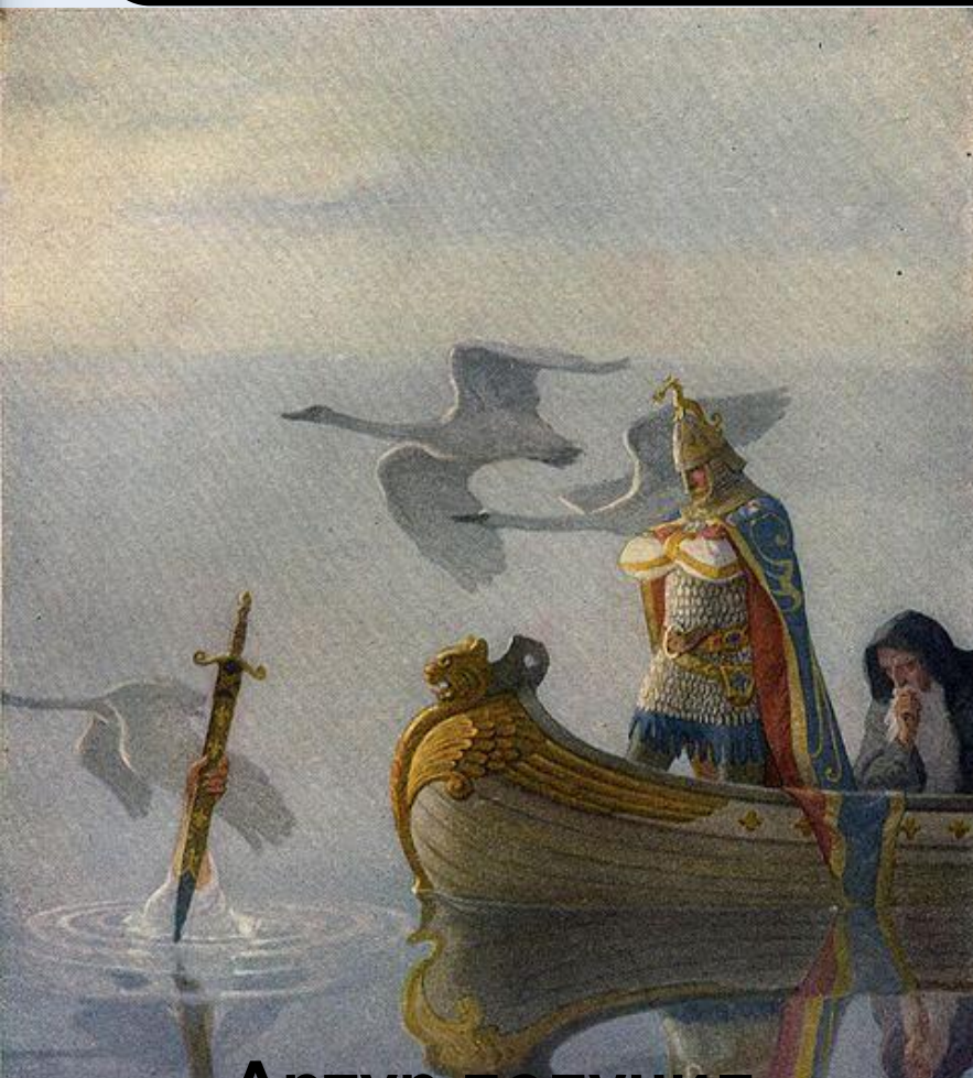
Артур получил Экскалибур от Девы Озера