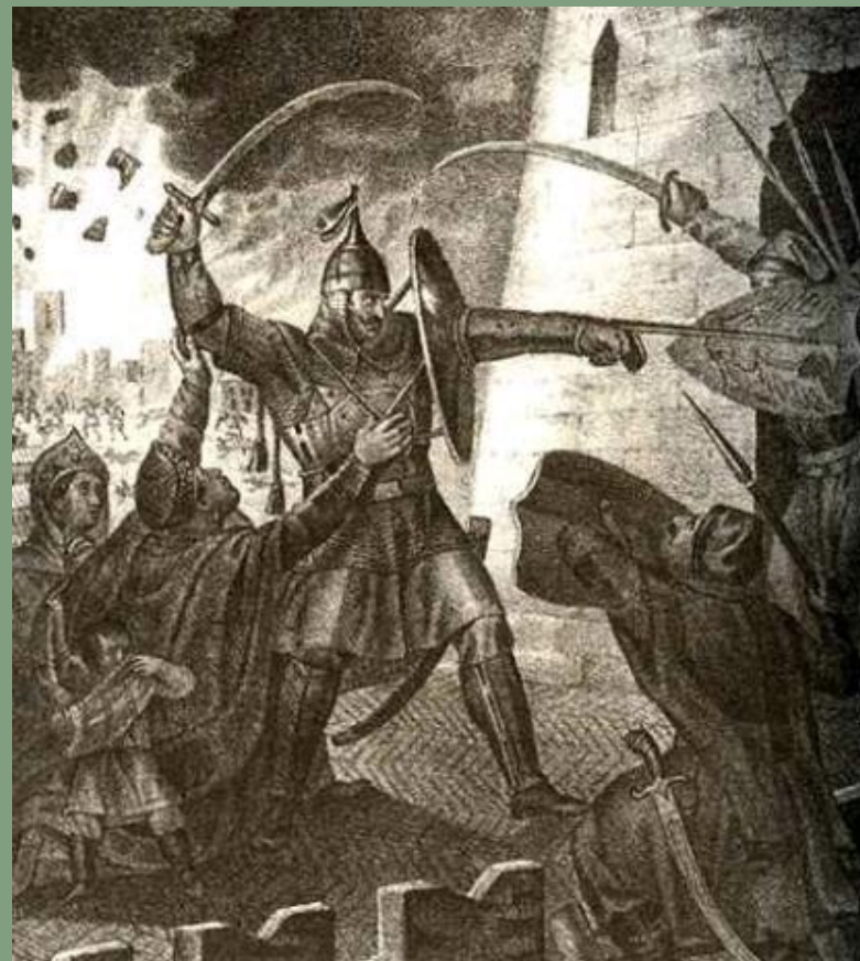
Михаил Борисович Шеин